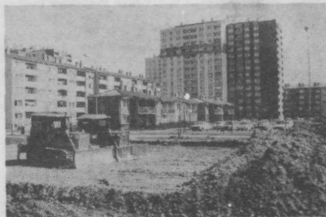
V Parmski ulici je že dalj časa primanjkovalo parkirnih prostorov. Zato se je KS odločila urediti nove parkirne prostore. Zemeljska dela so že skoraj pri kraju in upamo, da bodo na novih parkirnih krajih kmalu stali »konjički« našega časa.