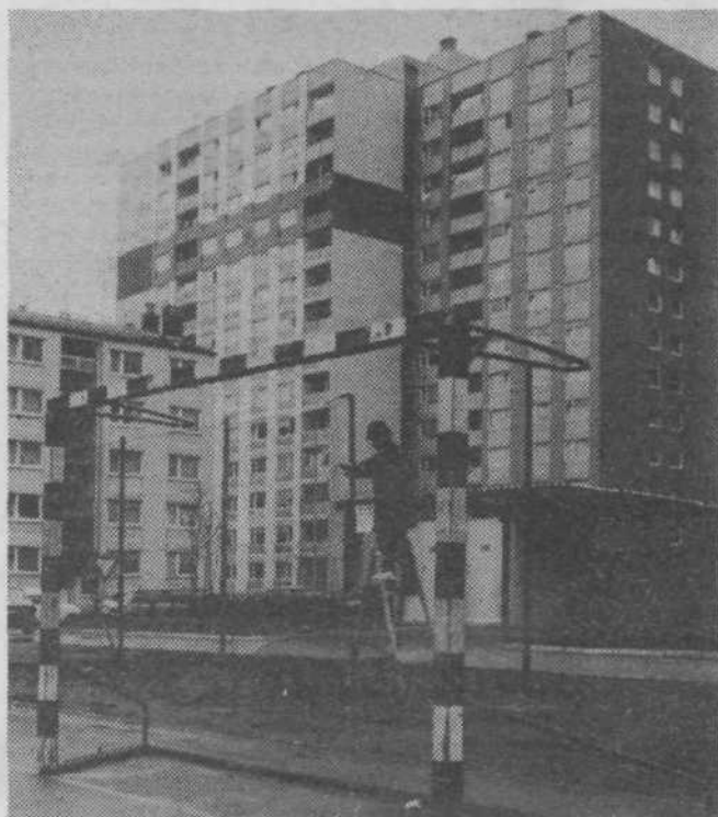
Mreže okrog športnega igrišča OŠ K'arla Destovnika-Kajuha so bile že popolnoma dotrajane. Nove je namestil solski hišnik — seveda brez pomoči stalnih vnetih žogobarjev — bombarderjev, kar jim ni v pohvalo. V bodoče bi se lahko tudi oni vključili v kako »malenkostno« delo, kot menijo nekateri bombarderji o nameščanju mrež...