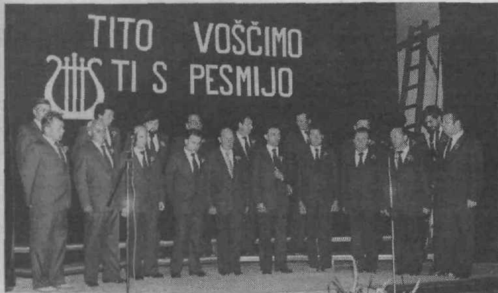
Moški pevski zbor DPD Svobode Črnuče.