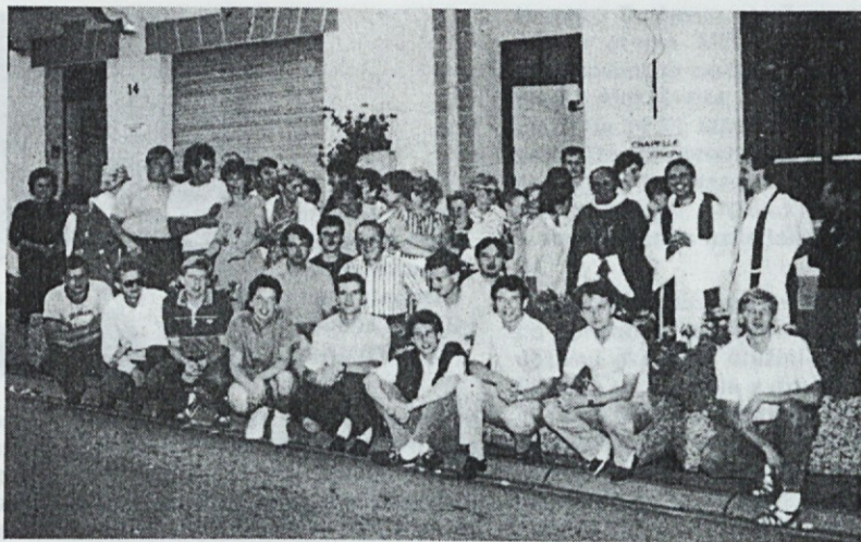
Srečanje slovenske skupnosti pred kapelo sv. Jožefa z bogoslovci iz Slovenije dne 24. avgusta 1987.