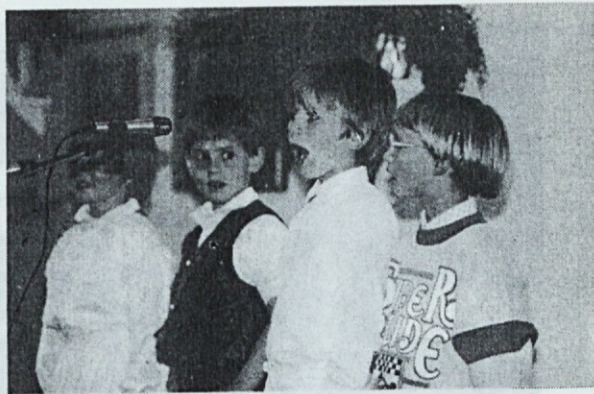
Najmlajši ob zaključku šole v Parizu (14. 6. 87)

Izredno lepo je bilo v letošnjem Marijinem letu romanje 15. avgusta na Loreto. Mogočno je donela naša pesem v Marijini baziliki. Organistu, dirigentu in vsem pevcem iskrena hvala!