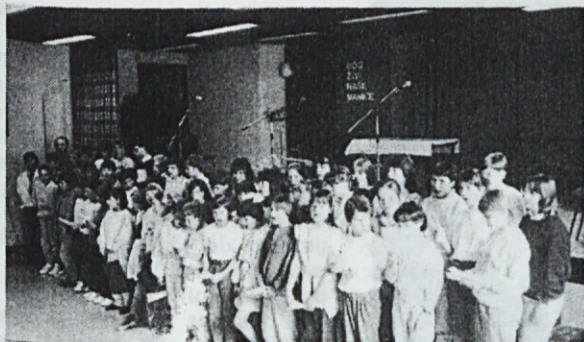
„Mami, oj mami...“ okrog 60 otrok poje svojim mamicam na materinsko nedeljo v Stuttgartu (10. 5. 87).

Moja želja da bi v bodočnosti ljudje, ki ču z misijo in njenim verskim ter kulturno-jezikovnim poslanstvom, ostali še naprej povezani v konstruktivnem dialogu, v medsebojnem zaupanju in iskanju sreče bližnjega, le tako bomo izpolnili svoje poslanstvo kot slovenski kristjani v tujini.