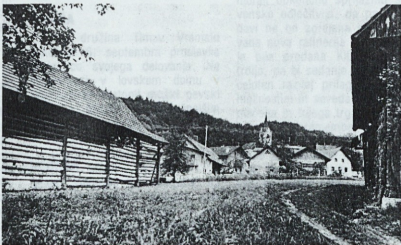
LANIŠČE blizu Javora pri Ljubljani.

na tromejo nad Ratečami je tudi letos zelo dobro uspel. Več tisoč ljudi iz Slovenije, Italije in Avstrije se je povzpelo na 1500 metrov visoko Peč. „Tu je srce Evrope. Edi-