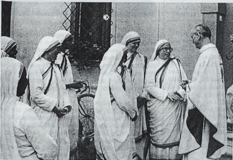
Na JEŽICO pri Ljubljani so prišle sestre m. Terezije, ki skrbi za najbolj uboge v Indiji.

Komnu in Veliki dol, je v soboto, 5. septembra, dobila novo telefonsko omrežje. Ob tem so pripravili tudi kulturni program, najzaslužnejšim občanom pa so podelili priznanja in pohvale. V Pliskovici je Kulturno-umetniško društvo Klasje iz Štanjela uprizorilo gledališko igro Vozel.