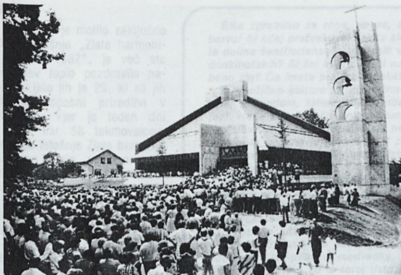
Nova cerkev sv. Cirila in Metoda v RADENCIH.