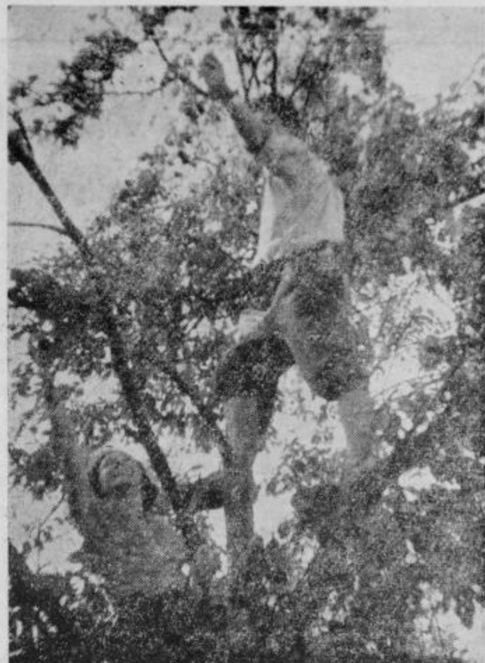
Slike so leto bogato obrodile

Čeprav ima obrt za svojo dejavnost na razpolago dovolj surov in materiala, poleg tega pa se je povpraševanje po obrtnih storitvah celo povečalo, je družbeni proizvod dosežen le 45 odst., dobiček pa 38 odst., za kar pravzaprav sploh ni opravičila. Seveda ne more biti drugače, če so plače porasle za 8 milijonov dinarjev, pri čemer