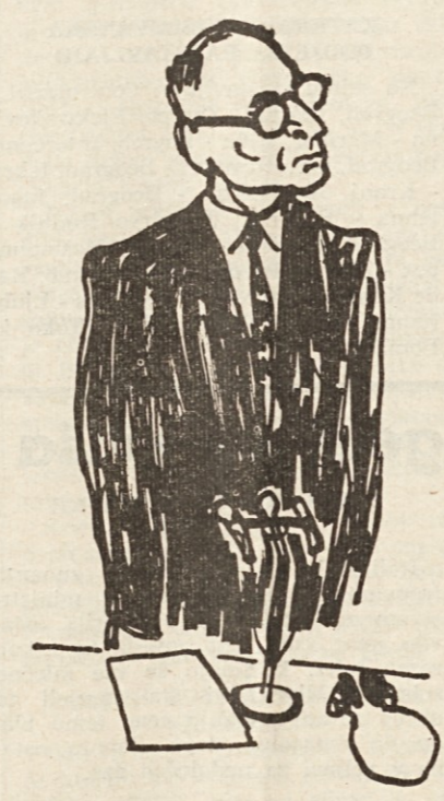
»V Jeruzalemu je bila pred nekako 1928 leti že velika sodna obravnava. Obravnava profi Jezusu Nazareškemu, sinu božjemu v človeški podobi. Zdjaj, skoraj 2000 let pozneje, stoji pred sodniki hudci v človeški podobi: Nemec Adolf Eichmann.«

Predsednik brazilske republike Janio Quadros je pooblastil državno pomorsko podjetje Loide Brasiliro, da nakupi v Jugoslaviji 36 ladij, in sicer 26 8500-tonskih in 10 10.500-tonskih ladij.