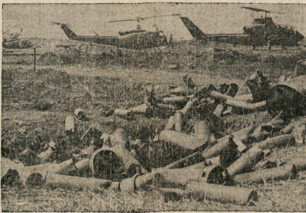
Z BOJISČA — Slika kaže Ham Nghi v severnem delu Južnega Vietnama, ki je služil za oporišče pohoda v Laos. V ozadju sta dva helikopterja, v ospredju patrone topniškega streliva in prazni sodi.