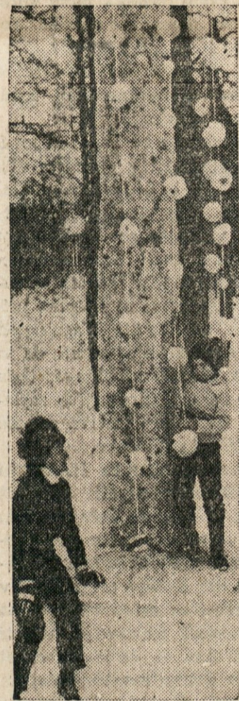
MLAJ POZIMI? — Seveda, toda na Finskem. Okrasili so ga s snežnimi kepami, nabranimi na vrvi.