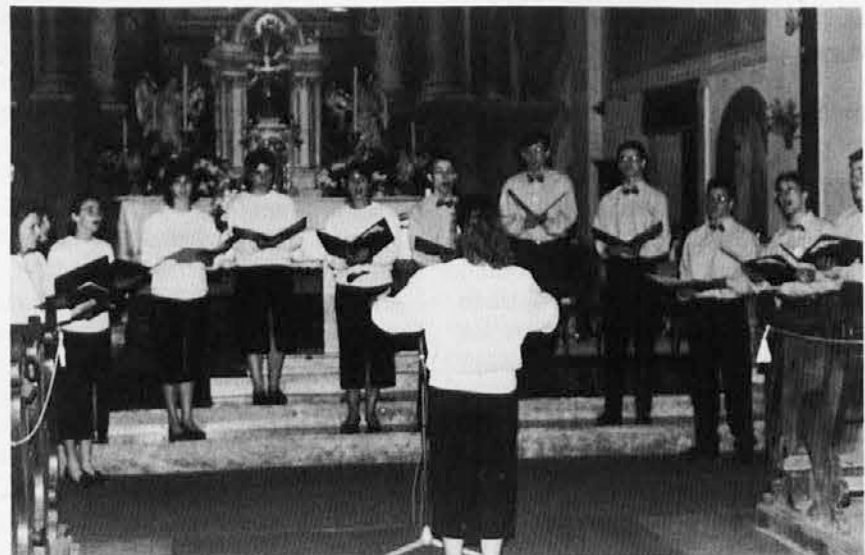
Vokalna skupina KRILA je v nedeljo, 12. decembra, žela mnogo uspehov, najsibo med mašo v Sovodnjah, kot tudi s samostojnim koncertom v Štandrežu

Slovenski center za glasbeno vzgojo »Emil Komel« in Glasbena matica v Gorici prirejata božične notranje nastope, ki bodo: v ponedeljek, 20.12., ob 19.30 v Katoliškem domu v Gorici, v sredo, 22.12., ob 18. uri v Kulturnem domu v Sovodnjah, v četrtek, 23.12., ob 17. uri v Sedejevem domu v Števerjanu.