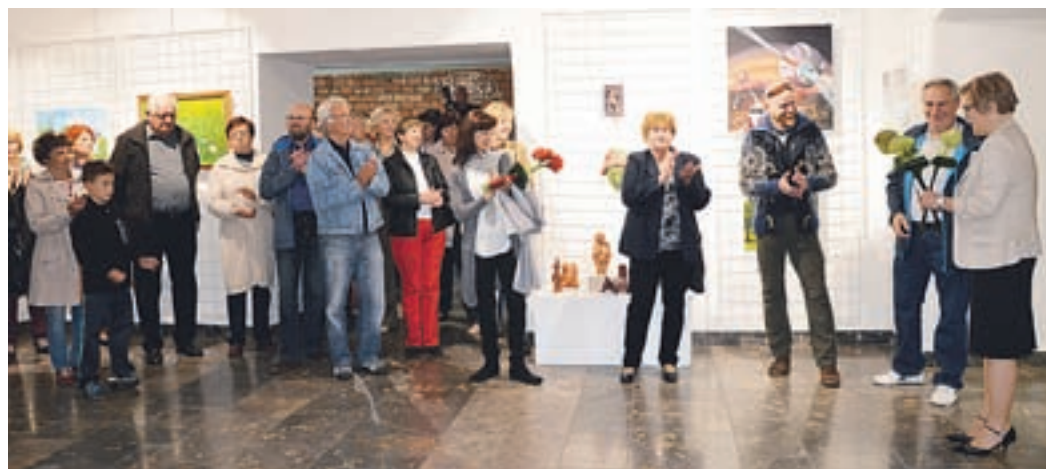
Galerija v vili Bianci je bila ob petkovi otvoritvi razstave premajhna za vse, ki so prišli nanjo. Zato so si mnogi dela ogledali šele, ko je bil uradni del otvoritve končan.

Tudi zasebno so prijatelji. »Ko smo letos dobili nove prostore, smo bili zelo srečni. Delavnice v njih pripravljamo tudi brez mentorjev, iskreno si povemo, kaj mislimo o ustvarjanju drug drugega.« V poletnih mesecih ne bodo počivali, kar nekaj njihovih članov se bo predstavilo na samostojnih razstavah, dodali pa bodo še kakšno društveno.