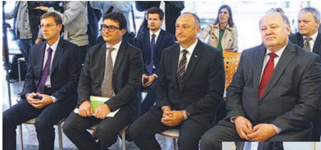
▲ Podpisa se je udeležil tudi predsednik slovenske vlade, dr. Miro Cerar (na sliki levo).

Gre za prvo transakcijo v Sloveniji iz programa »InnovFin – Financiranje EU za inovatorje«, nove generacije finančnih instrumentov s podporo Evropske unije v okviru programa Horizon 2020, na katerega je ponosna evropska komisarka Violeta