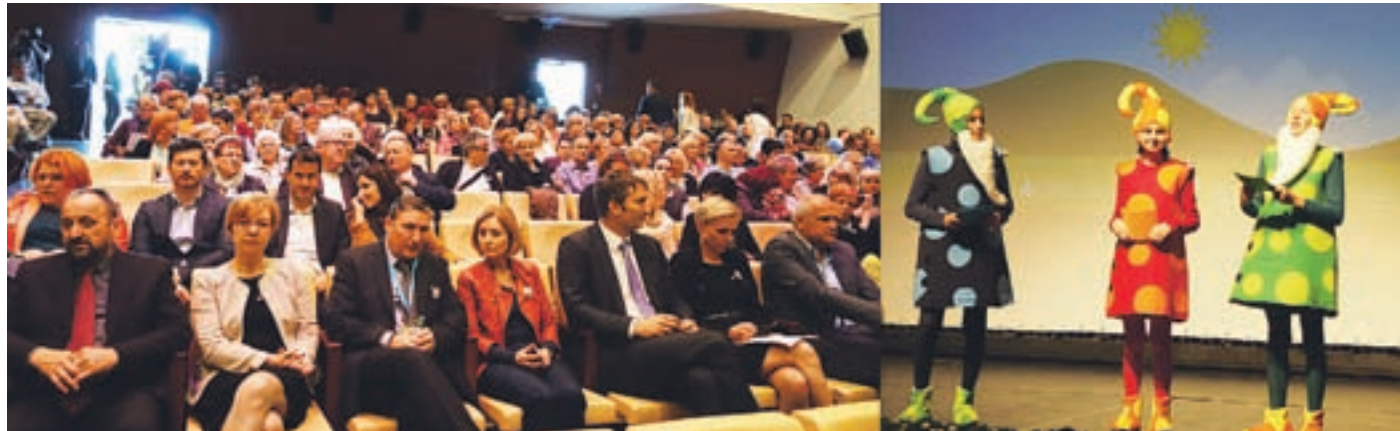
Osrednjo prireditev so pripravile vse generacije, povezovali pa so jo Goriški škrtari, ki so zabavali in tudi učili občinstvo.

Denar bo na razpisih, ki jih andragoški zavodi in nevladne organizacije pričakujejo v tem letu, delilo Ministrstvo za izobraževanje, znanost in šport. Velenjska ljudska univerza namerava prijavititi svoje neformalne izobraževalne programe ter aktivnosti za opismenjevanje prebivalstva, svetovanje, študijske krožke, središče za samostojno učenje, osnovno šolo za odrasle, tudi Teden vseživljenjskega učenja, je povedala direktorica.