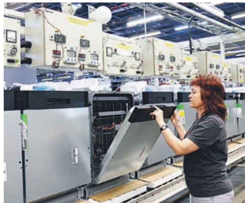
12. maja je v Gorenju stekla proizvodnja pomivalnih strojev blagovne znamke Gorenje, najprej za slovenski trg, v drugi polovici leta pa tudi za tujega.

Pomivalni stroji Gorenje SmartFlex, ki jih odlikuje prilagodljivost življenjskemu slogu uporabnika, ob naprednih tehničnih zmogljivostih, inovativnih rešitvah in energijski učinkovitosti pa tudi preprostost uporabe. So rezultat dela Gorenjevih lastnih razvojnih timov. Razvoj je potekal dve leti in pol na Švedskem, v enem od Gorenjevih razvojno kompetenčnih centrov. V Skupini Gorenje so tovrstne centre vzpostavili za raziskave in razvoj vseh kategorij izdelkov, in sicer v Nizozemskem, Švedskem, Češkem in v Sloveniji, v njih pa delajo multikulturni timi sodelavcev, ki sodelujejo tudi z mednarodnimi razvojnimi in izobraževalnimi institucijami.