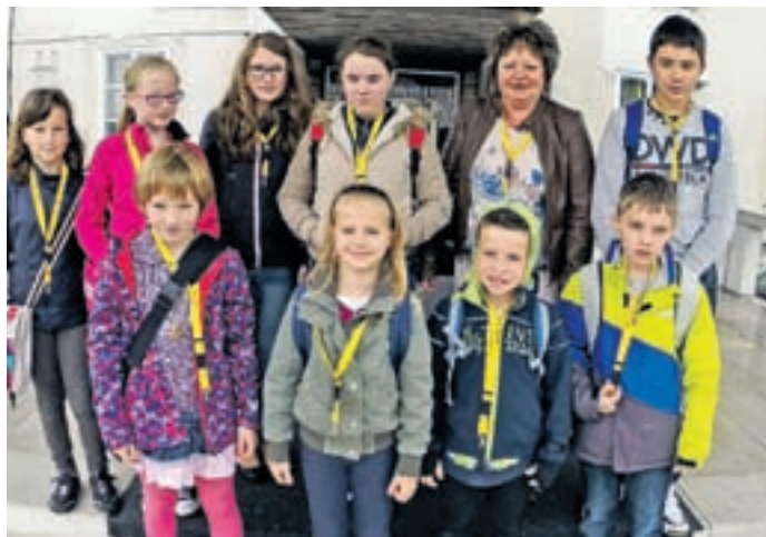
Letošnji nagrajenci na državnem natečaju Evropa v šoli so nagrade prejeli v petek v Ljubljani.

Kar 5 mladih Šalečanov v Ljubljani prejelo nacionalne nagrade za svoja dela