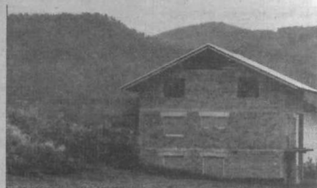
Ob novozgrajeni hiši se lepo vidi, koliko materiala je hudournik v nekaj sto letih nanese. Voda je doslej tekla po vrhu tega grebena, zato ni nič čudnega, da se je večkrat razlila in poplavlila bližnja polja, zdaj pa skrbi zaradi poplav ne bo več.

V krajevni skupnosti Dol se končujejo nadvse pomembna dela pri urejanju dveh hudournikov, ki sta v preteklosti zakrivila že tudi nekaj poplav. Investitorji Kmetijska zemljiška skupnost, ki je prispevala več kot polovico potrebnega denarja, Območna vodna skupnost Ljubljana-Sava, Republiška skupnost za ceste SRS in občinska skupščina Bežigrad so zagotovili 1,25 milijona dinarjev.