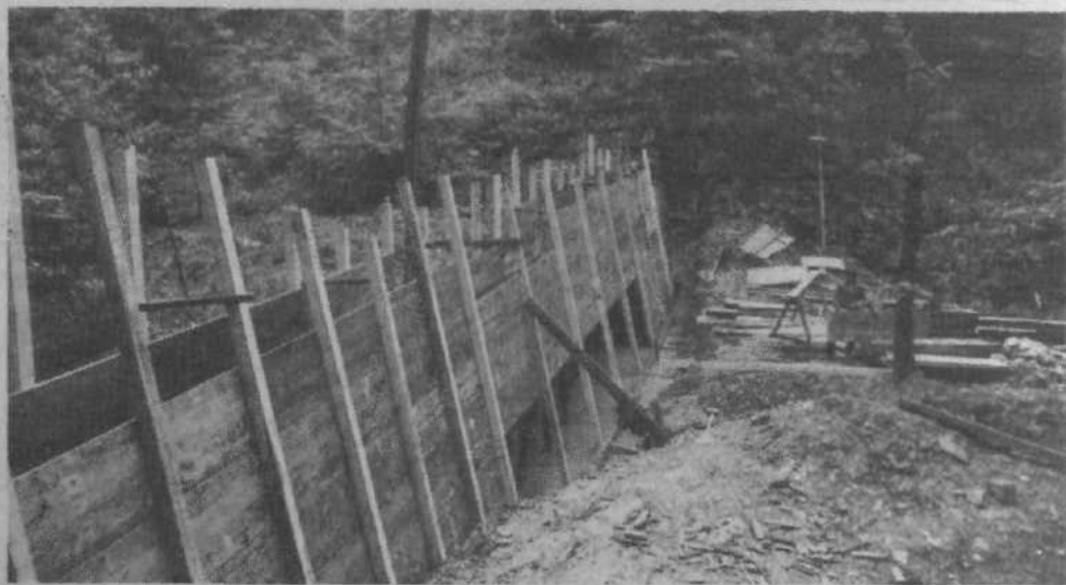
Največ dela je bilo z zadrževalno zaporo na Klemenčevem grabnu, ki bo zadrževala prodnati material. Zapora je široka 45 m, na najvišjem mestu pa meri 3 metre. Zaradi podražitve del bodo Zaborški hudournik uredili šele prihodnje leto, Klemenčev graben pa bodo takrat uredili do izliva v Lisco.