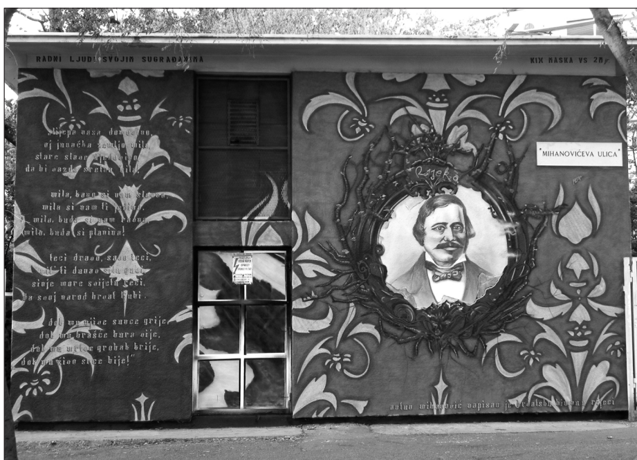
Mural Antun Mihanović, julij 2014

Rečana, dobitnika prve zlate medalje za neodvisno Hrvaško na svetovnem prvenstvu v full contactu in kick boxingu , ki je bilo od 6. do 8. decembra 1991 v Parizu. Toda dve leti pozneje je lastnik objekta poslikavo prebarval. V tem kontekstu se postavlja vprašanje, zakaj murali ne veljajo za umetniško materialno dobrino, ki se ne bi smela izbrisati? Če ostanemo pri Reki, murali so predvsem kulturni izdelki, ki so jih financirali prebivalci mesta sami in jih namenili svojim someščanom. Zakaj ne brišemo umetnosti, ki je institucionalizirana, formalna in klasična? Zdi se, da najpogosteje obstane in je zaščiten tisto delo, ki se afirmira v določenih ideoloških okvirih in ki je povezano s tradicionalnim socio-političnim razvojem urbanizma, ter da se dejavnosti street arta še vedno potiskajo na obrobje družbe. Z vzpostavljenim komunikacijskim procesom, ki nastane s prenosom sporočil prek muralov, se želi dekonstruirati vnaprej določena stališča o različnih dejavnostih, pomembno vlogo pa ima aktivnost udeležencev, kar poudarja dinamičnost grafitov, a tudi njihovo izpostavljenost spremembam (Botica, 2001).