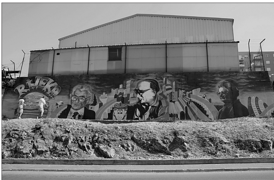
Mural Mesto Baltazar i reški profesorji , junij 2012

Lokacija je enako pomembna zato, da senzibilizira vse več ljudi za take projekte, ki se tako začnejo neustavljivo širiti. Zame je bila najpomembnejša lokacija na Mihanovičevi – in sam Mihanović, ker se ime ulice neposredno ujema z opravljenim enciklopedijskim vnosom. (Gustin, intervju, 2015)