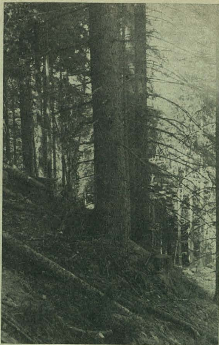
V takem gozdu še hudič ne bi imel kaj jesti

Prosto živečim živalim moramo vrniti vsaj del njihove naravne hrane z zaščito in ponovnim zasajevanjem teh sadonosnih vrst v naše gozdove, njihove robove in jase. Seveda to ne pomeni, da bi lovci lahko na to zviševali stalež divjadi po mili volji. Ta ukrep naj ima za cilj zmanjšati škodo v gozdovih in na poljih, ter izboljšanje kvalitete avtohtone divjadi. S tem ne mislim biti pobudnik ali zagovornik spreminjanja naših gozdov v grmovje in manj vredne sestoje, v katerem bi lovci imeli svoj »živalski hlev«. Opozoriti hočem le gozdarje na soodgovornost za živalski svet, ki je naravni sestavni del naših gozdov. S pravilnim gospodarjenjem in popravljanjem napak iz preteklosti, lahko močno zmanjšamo škodljive vplive rastlinojedov in tudi ustavimo občutno nazadovanje števila in vrst ptic v naših gozdovih.