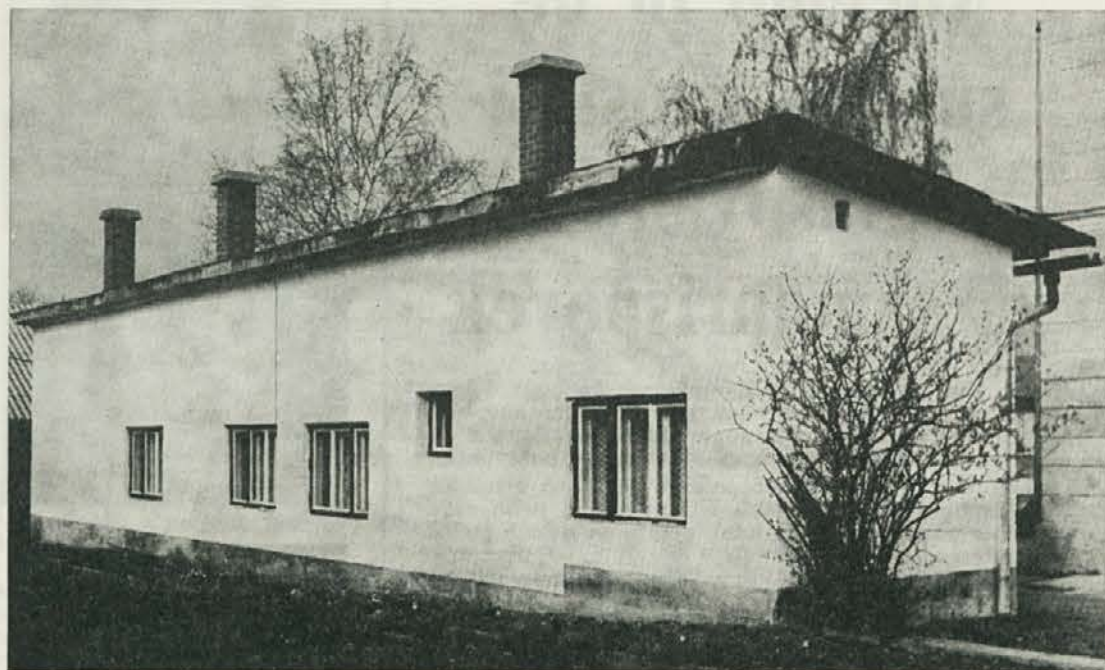
Stavba Gozdarstva Slovenj Gradec

Velunje, Graške gore, Mislinjske doline, pa vse tja do Sel.