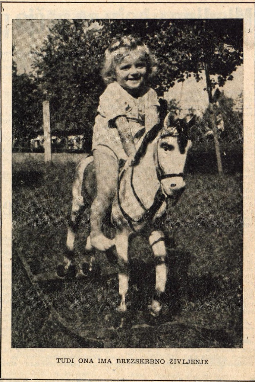
TUDI ONA IMA BREZSKRIBNO ŽIVLJENJE

Občinski ljudski odbor je tudi odobril spremembo družbenega plana ob-