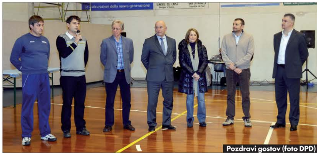
Pozdravi gostov

V Slovenskem športnem centru Mirko Špacapan v Gorici je vodstvo Amaterskega športnega združenja Olympia v petek, 22. novembra, s ponosom predstavilo svoje odbojbarske ekipe, ki bodo v sezoni 2012-13 nastopale v različnih pokrajinskih in deželni prvenstvih.