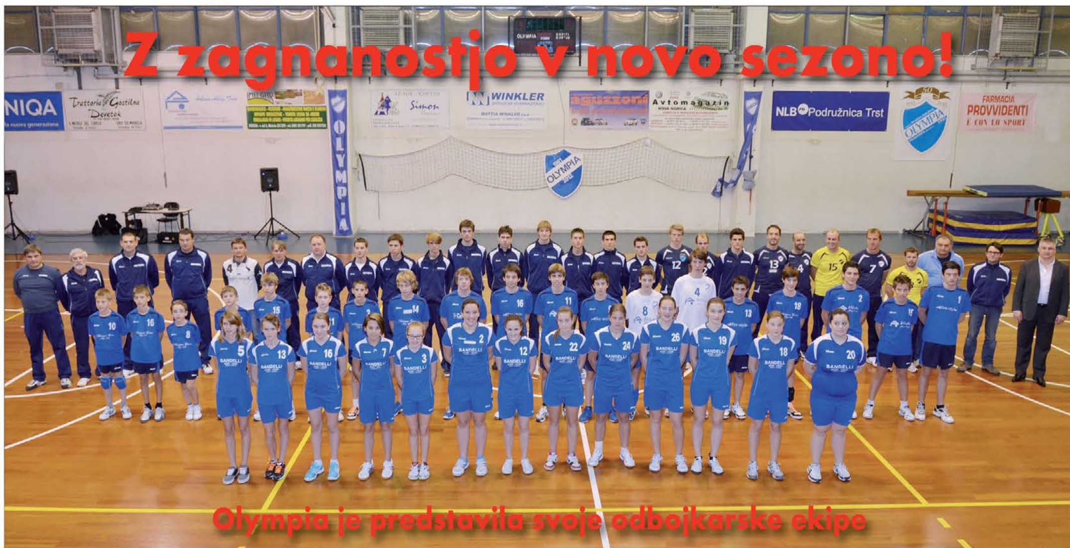
Olympia je predstavila svoje odbojgarske ekipe