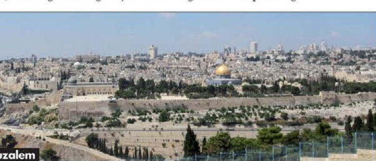
Pogled na Jeruzalem

odrešenjem. Najlepši pogled na Jeruzalem je z Oljske gore. Tudi tu je veliko krajev, ki so priče zadnjih dogodkov Jezusovega življenja: vrt Getsemanski z mogočnimi oljkami, kraj Jezusovega smrtne boja. V bazi-