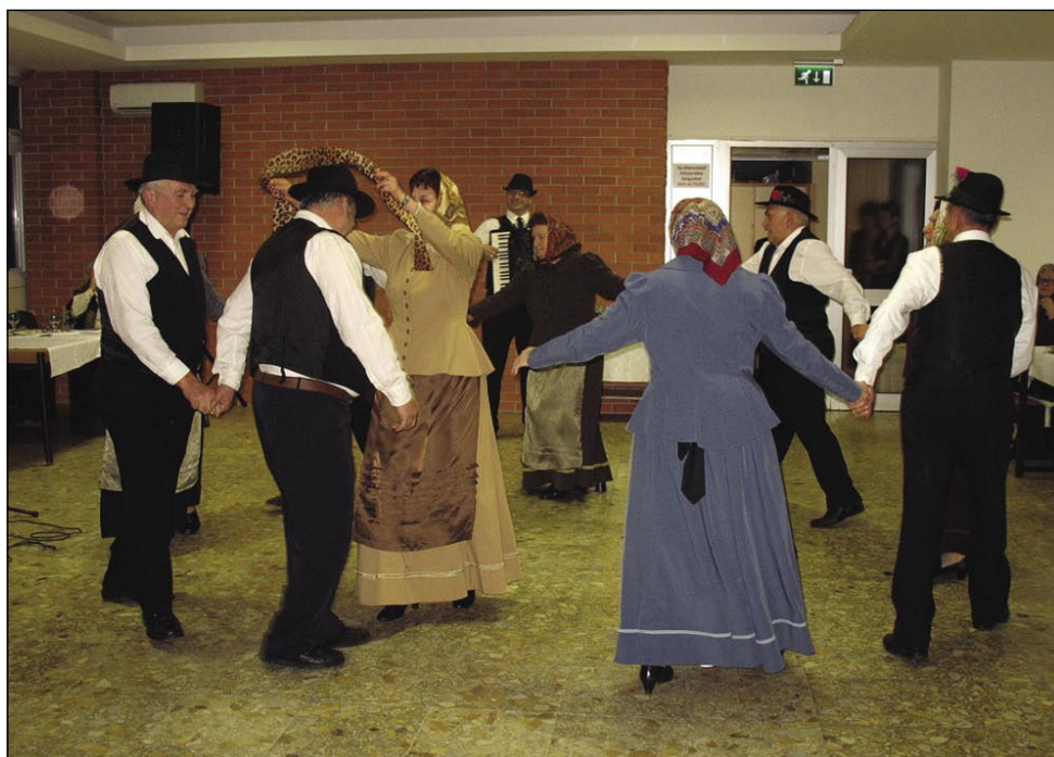
Upokojenci iz Melinec so odplesali prekmurske plese

Prireditev je obiskala ve-leposlanica RS v Budim-