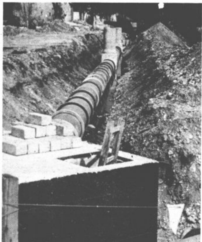
V Nazarjah uspešno nadaljujejo z izgradnjo primarne kanalizacije za čistilno napravo s katero bodo povezali Rečico, Nazarje in Mozirje. Sredstva zanjo med drugim prispevajo tudi občani in delovni ljudje Gornje Savinjske doline, saj je čistilna naprava vključena v program samoprispevka.