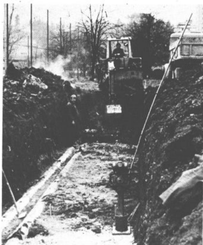
Delavci Vekosa—tozd Toplovod ob Šaleški cesti menjujejo poškodovane toplovodne cevi. Čeprav del, ki jih bodo morali opraviti, ni malo, morajo poleg izkopa precejšnjih kubikov zemlje zamenjati vse iztrošene cevi, obzidati jašek, bodo nalogo predvidoma končali prihodnji mesec.