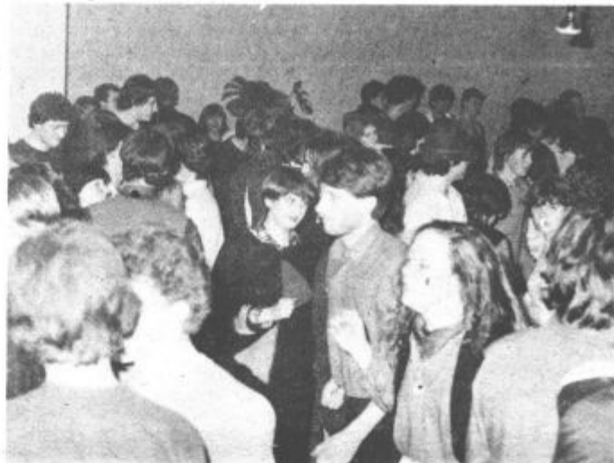
Mladi si želijo, da bi bilo še več takšnih in podobnih prireditev v Delavskem klubu

Konovem. Gledalcem so se predstavili člani kulturnih društev iz osnovnih šol Miha Pintar-Toledo, Anton Aškerc, bratov Letonje in prosvetnega društva iz Zavodnj ter člani Šaleške folklorne skupine Koleda. Kot gost pa je nastopilo Gledališče pod kozolcem iz Smartnega ob Paki. Kakšnih 150 gledalcev je bilo zadovoljnih s tem (seveda z enimi bolj, z drugimi manj) kar so skupine prikazale.