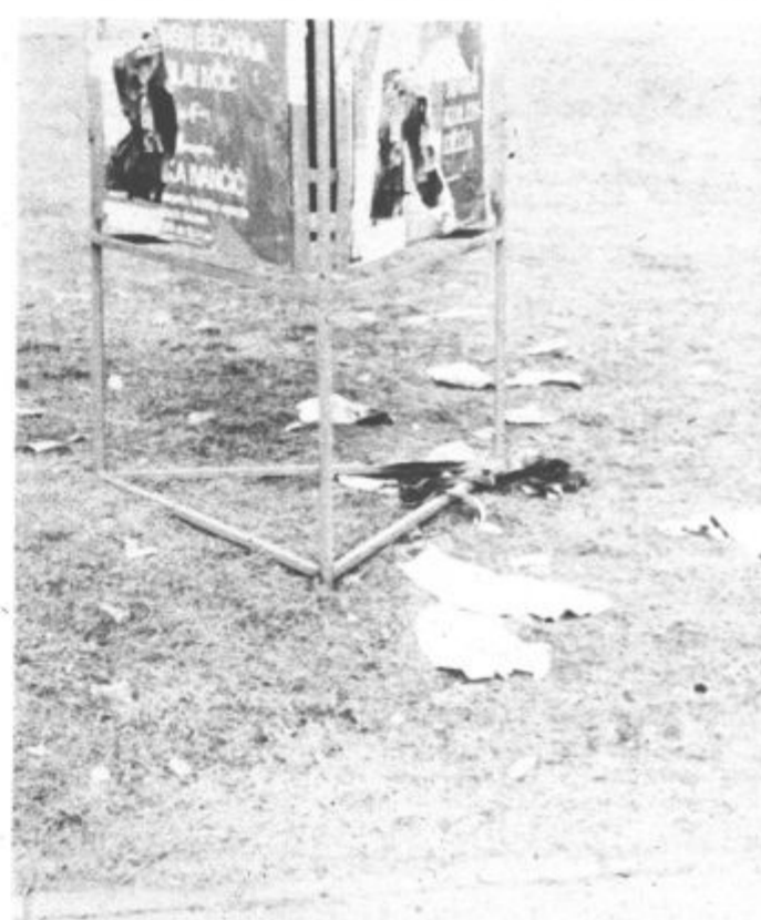
Veseli smo novic o akcijah čiščenju okolja. V mnogih krajih so se krajani nadvse zgležno lotili čiščenja svojega okolja. Žal, pa povsod še ni tako. O tem zgovorno kaže gornji posnetek napravljen v sredšču Titovega Velenja.