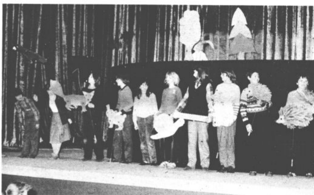
Mladi kulturniki iz osnovne šole Miha Pintar-Toledo so predstavili lutkovno igrco Dva ježka

V soboto in nedeljo popoldne je bila na Ljubnem ob Savinji letošnja občinska prireditev Naša beseda 82. Nastopili so mladi kulturniki iz Luč, Gornjega grada, Nazarj, osnovne organizacije Iverna in z Ljubnega. Pregled kulturnih dosežkov mladih mozirske občine je vzbudil tudi precej zanimanja med gledalci, na regijsko prireditev, ki bo 28. in 29. aprila v Mozirju pa so se uvrstili mladi iz Na-