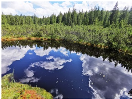
Barje Za blatom na Jelovici. (12. 7. 2020)