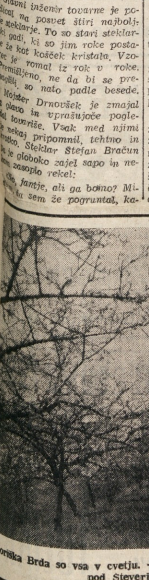
Goriska Brda so vsa v cvetju. — Na sliki vidimo sadovnjak pod Steverjanom.