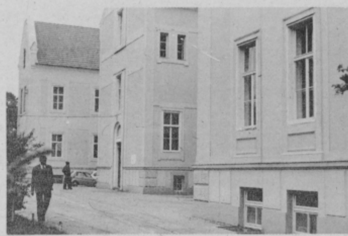
Dvorišče psihiatričnega oddelka bolnišnice v Ormožu.