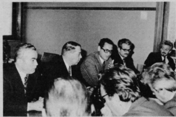
Sovjetski gostje v razgovoru s predstavniki TGA Kidričevo.

„Zveza socialistične mladine Slovenije je revolucionarna organizacija; geslo revolucije pa je: izborimo si prostor pod svobodnim soncem! Mladina mora smelo korakati, naloga si mora zartovati daljnosežno in ne delati od dneva do dneva,“ je končala Nada. MG