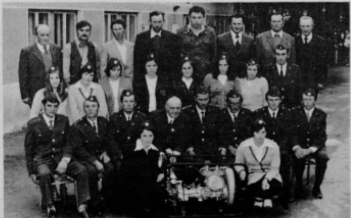
Člani GD Zavrc ob svojem jubileju.

Ne samo med člani GD Zavrc, ampak med vsemi ljudmi naj vlada geslo: „V SLOGI JE MOĆ!“