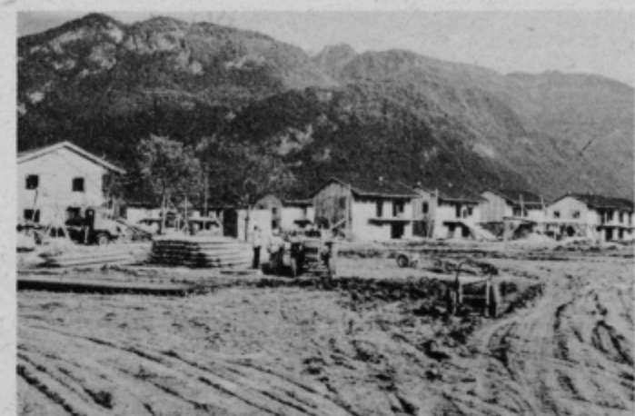
Za njimi že montirajo Marlesove hiše.

S 1. novembrom so bila zidarska dela pri kraju. Tudi Marlesovi delavci so z montažo hiš v glavnem že končali. Naselje pa s tem še ni vseljivo, ker je treba opraviti še kup „malenkosti“, kot napeljavo vodovoda, kanalizacije in elektrike. Vse to, kot pravijo, bo čez kak mesec že tudi opravljeno. Šele takrat bo naselje, v katerega so