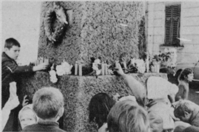
Pionirji šole Lovrenc na Dravskem polju so prižgali mnogo lučk pred spomenikom padlih.

Poleg osrednje svečanosti na ptujskem pokopališču so spomin na pokojne, naše najdražje, predvsem pa na tiste, ki so darovali svoje življenje za naš lepši jutri, svečano počastili v vseh krajevnih središčih na območju ptujске občine. Predvsem otroci iz osnovnih šol so prizadevno sodelovali pri okrasitvi grobov in s kulturnimi programi.