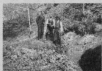
Pri izviru slatine ali Vodebov studenec 28. aprila 1936.

Izvršni svet je sprejel stališče, da je treba zagotavljati skladni razvoj družbenih dejavnosti, vendar je nujno dati določeno prednost razvoju zdravstva in izobraževalno-vzgojnemu področju. Za uresničitev nalog na področju družbenih dejavnosti pa je nujno razvijati gospodarske dejavnosti, ker le tako bomo lahko zagotavljali sredstva za družbene dejavnosti in učinkovito uveljavljali svobodno menjavo dela. m. g.