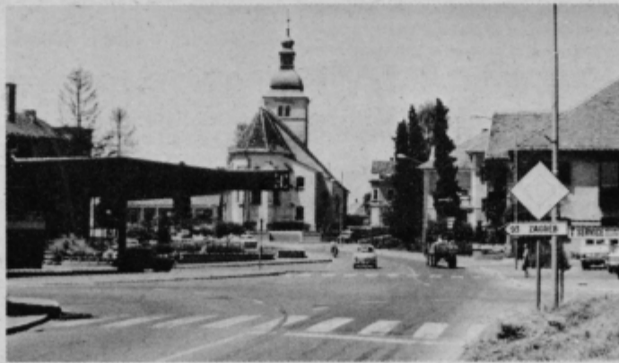
Ormož — središče občine, ki je po uspehu solidarnostne akcije na 14. mestu v Sloveniji.

Občinska konferenca SZDL Ormož je, ko je obravnavala vsa poročila o delovanju delegatskega sistema, sprejela tudi nekaj zelo važnih stališč, ki so jih delegati zborov soglasno potrdili. V razpravi so delegati iz krajevnih skupnosti in združenega dela ugotavljali, da je v številkah in odstotkih nemogoče ugotavljati uspešnost delegatskega sistema. Sistem je zaživel, so ugotavljali in ocenjevali delegati, v naslednjih letih bo še bolj zaživel in prinesel tiste rezultate, ki smo si jih z njim zastavili. Ocena delegatskega sistema je dobra in zadovoljiva, delegatski sistem je novost in bi bilo narobe, če bi ga že sedaj