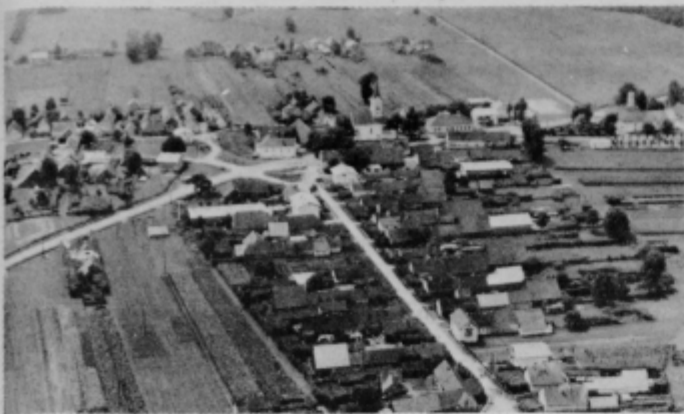
Ložnica na Dravskem polju se vse bolj razvija.