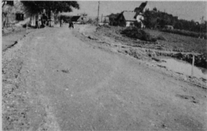
Cesta med Ptujsko goro in Majšperkom bo kmalu dobila asfaltno prevleko

Občinski štab za izvedbo javnega posojila za ceste v občini Ptuj je na zadnji, verjetno predzadnji seji, saj bo akcija vpisa s koncem oktobra končana, pregledal dosedanje delo in ocenil vpis posojila. Podatek, da smo v ptujski občini do 25. oktobra 1976 dosegli 154,13 odstotni vpis posojila glede na obveznost, ki jo je določila republika, presega vse še tako optimistične napovedi ob začetku akcije. Po uspešnosti vpisa smo na četrtem mestu v Sloveniji in če so do konca oktobra tudi zamudniki