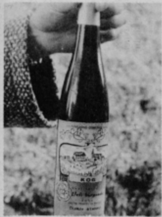
Steklenica vinogradnika Stanka Ćurina.