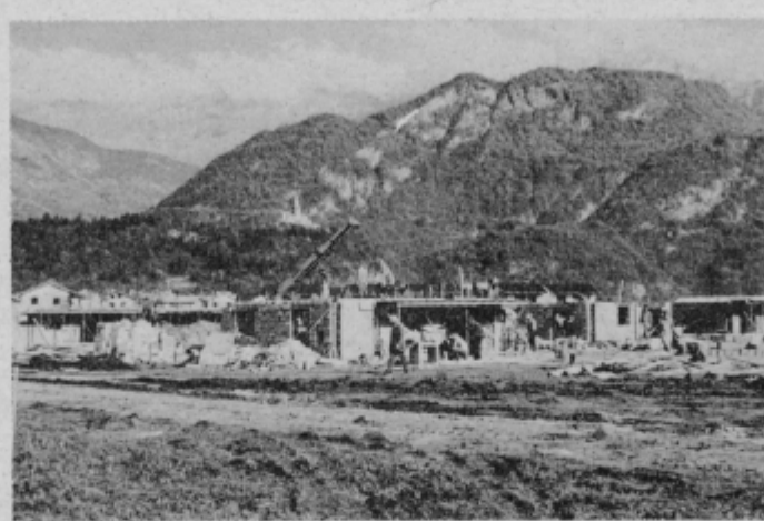
Delavci Gradisa gradijo visokopritlične kleti v Kobaridu.

Del okolice po potresu prizadete Kobarida je ves mesec oktober spreminjal svojo podobo. Tik ob robu mesta, kjer so domačini še pred mesecem pobirali krompir, koruzo in ostale polj-