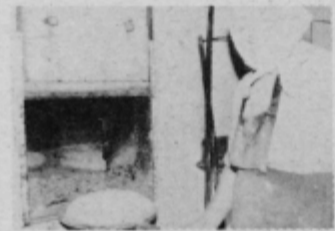
Globovnikova mamica ob svojem vsakodnevem opravilu.

Sama zatrjuje, da ji peka kruha pomeni, skupno s pečenjem še številnih drugih domačih specialitet, posebno zadovoljstvo. To velja le za pečenje v peči svojih prednikov, to je v „črni peči“. Čeprav ima v kuhinji tudi sodobnejšo peč se pri pečenju specialitet vedno odloča za