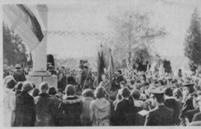
Na mestnem pokopališču v Ptuj se je na komemorativni svečanosti zbralo več tisoč občanov.

V nadaljevanju svojega govora je označil veličino narodnoosvobodilnega boja, njen pomen za današnji samoupravni socialistični družbeni razvoj in osvetlil današnji politični trenutek, ko znova oživlja fašistična misel in izrazil vso