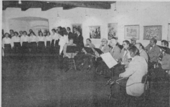
Motiv iz razstave v paviljonu Dušana Kvedra v Ptuj.

K številnim razstavam, ki so se letos že zvrstile v razstavnem paviljonu Dušana Kvedra, smo v začetku oktobra prišli še eno: likovniki amaterji iz bratskih občin SR Hrvatske in Slovenije so se letos ponovno predstavili ptujskemu občinstvu, ki je že na otvornitveni slovesnosti pokazalo zanj