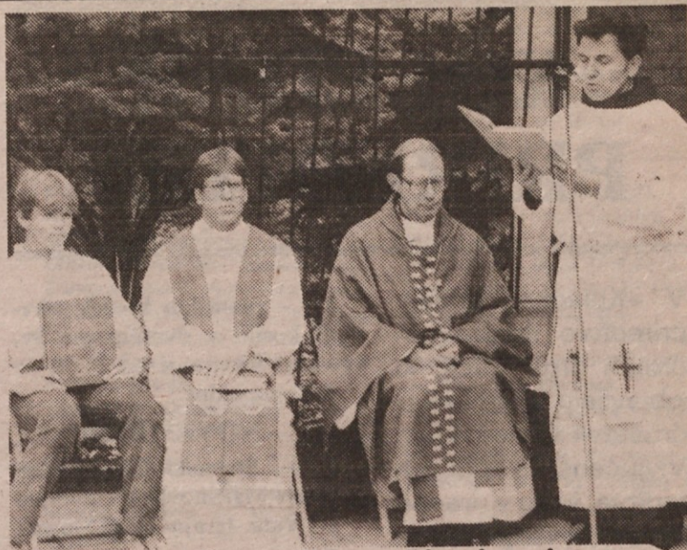
Med sv. mašo na Slovenski pristavi

Tudi zaključne slovesnosti 23. Olimpiade v Los Angelesu so bile odlično pripravljene. Tako, ko je olimpijski ogenj ugasnil, so zagoreli ogromni ognjemeti in na stadionu so se začeli tekmovalci in gledalci segati v roke in objemati ne glede na jezik, vero in polt. Poslavljali so se s solznimi očmi in vzklikali: »Na svidanje na 24. Olimpiadi v Seoulu, Južna Koreja!« Na kratko: 23. Olimpiada v Los Angelesu je bila odlično organizirana, zato je žela velik športno-moralni