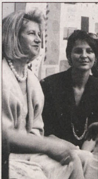
Ravnateljica celovške dvojezične ljudske šole Hambruševa in učiteljica Nachbarjeva Šolarski živ-žav na igrišču Mladinskega doma

Solarji javne dvojezične ljudske šole v Celovcu so zaključili prvo šolsko leto. V varstvu v Mladinskem domu, kamor so po pouku zahajali, se tam učili in igrali, so starši, vodstvo varstva in otroci pripravili malico in kratek kulturni spored. Na piknik so povabili tudi tiste otroke, ki bodo jeseni pričeli s prvim razredom. Sproščen živ-žav je potrdil, da so s šolo zadovoljni.