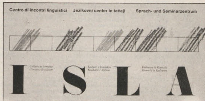
Predstavitveni programski zvezek ISLA-kulture v kontaktu

V maju preteklega leta so sodelavci celovške univerze ustanovili društvo KUKO, ki naj bi opravljalo izobraževalno dejavnost, prirejalo raznovrstne tečaje (predvsem jezikovne), s svojo dejavnostjo pa naj bi posegalo tudi na širše področje človekovih potreb in ustvarjalnosti. Ime društva je kratica slogana KULTURE v KONTAKTU in v svojem bistvu nakazuje interkulturno usmerjenost dejavnosti, program pa je zasnovan dosledno trijezično (nemško, slovensko in italijansko). KUKO bi prav zaradi tega lahko pojmovali tudi kot alpe-jadransko izobraževalno inštitucijo.