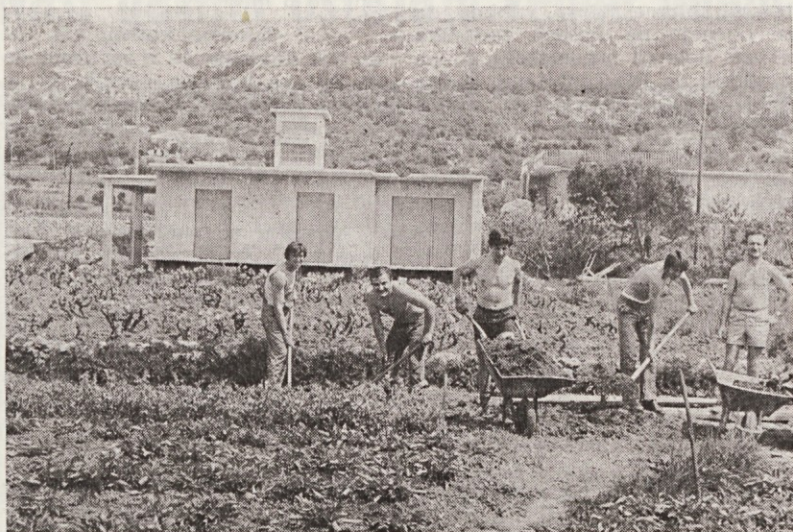
Prostovoljci pri gradnji dovozne poti do počitniškega doma na Rabu

Vendar moram še dodati, da za sedaj parkirni prostor ob domu še ni urejen in bo avto še vedno treba puščati na starem parkirišču. Vse pa tako kaže, da bomo v prihodnjem letu lahko ne samo pripeljali do doma, pač pa tudi avto pustili na urejenem parkirišču v neposredni bližini našega doma.