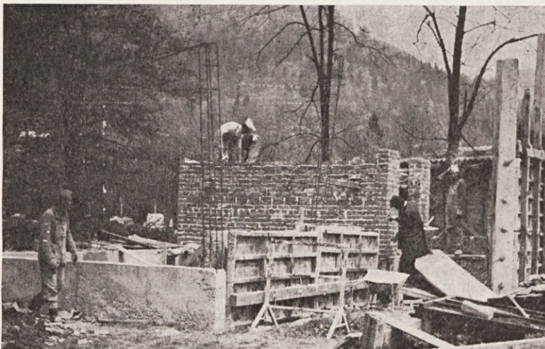
Gradnja skladišča vnetljivih tekočin