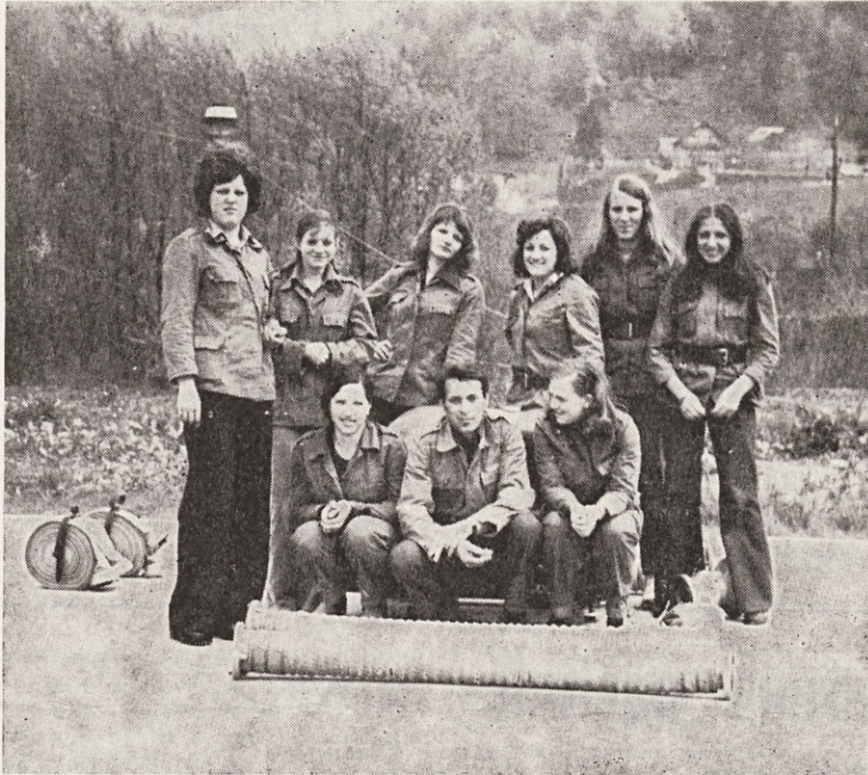
Naše gasilke pridno vadijo in nastopajo