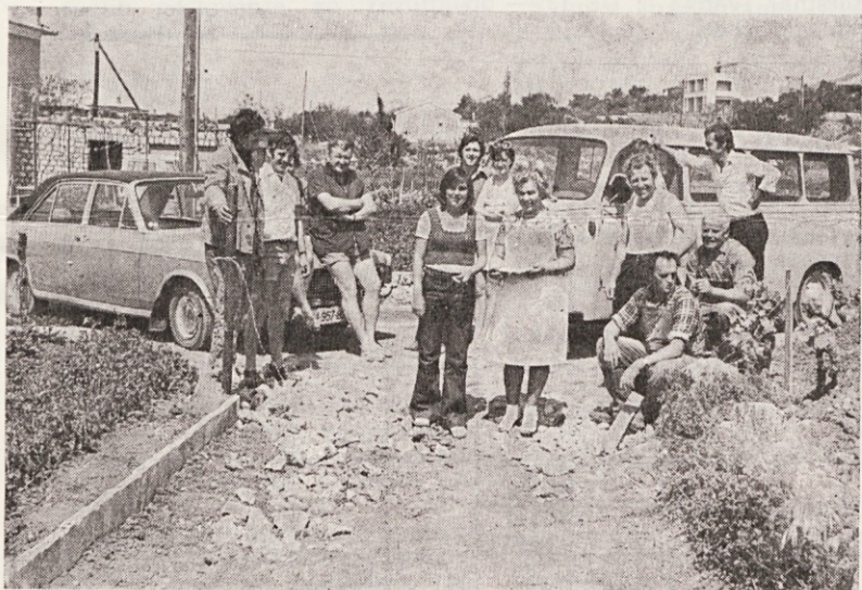
Udeleženci prve majske akcije na Rabu