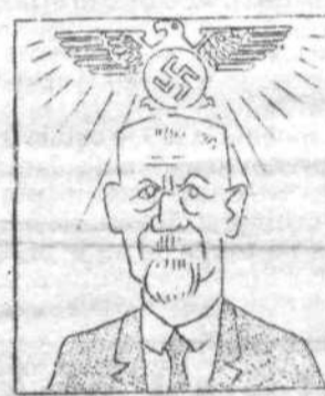
1943 Präsident der Provinzialverwaltung Leo Rupnik