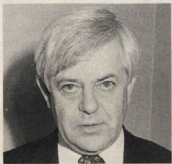
Slovenski predsednik Kučan

SLOVENIJA je bila preteklo nedeljo v znamenju predsedniških volitev. Te so kar nekaj časa zaposlovale slovensko politiko, čeprav so mnogi napovedovali absolutno zmago dosedanjega predsednika Milana Kučana. Ta je že v prvem krogu zmagal s 55,5 odstotka glasov.