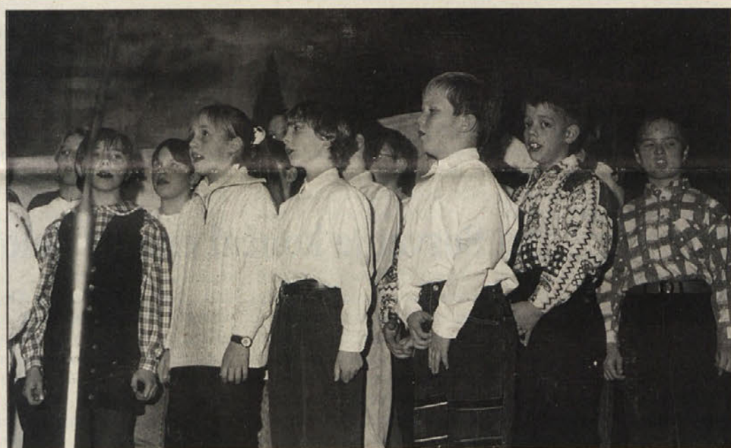
Na sliki je del otroškega zbora »Zarja« iz Železne Kaple. Številni naraščaj je garant za bodoče delovanje prosvetnega društva, ki je v soboto praznovalo 90-letnico s priznanja vredno kvalitetno prireditvijo. 90 let obstoja pa so praznovali tudi v Žitari vasi in tamkajšnja »Trta« je prav tako predstavila presek svojega delovanja. Od teh dveh prireditvah lahko preberete kaj več na strani 5.