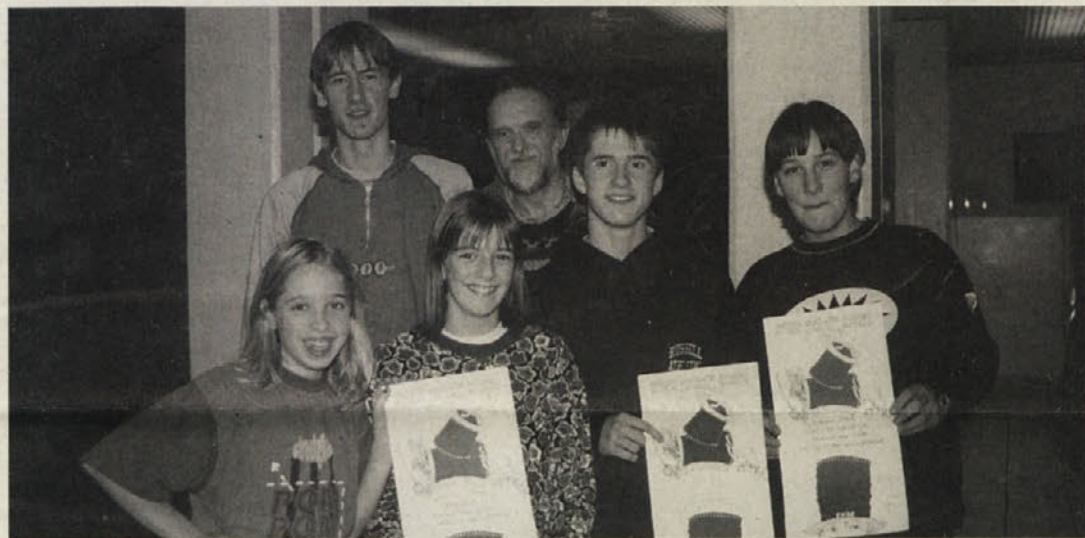
Mladi filmski ustvarjalci iz Mladinskega doma SŠD v Celovcu

Še vabilo vsem, ki tole prebirate: lahko se udeležite filmskega krožka, ki je vsako sredo ob 18.30 v Mladinskem domu v Celovcu. Gregor Krevs