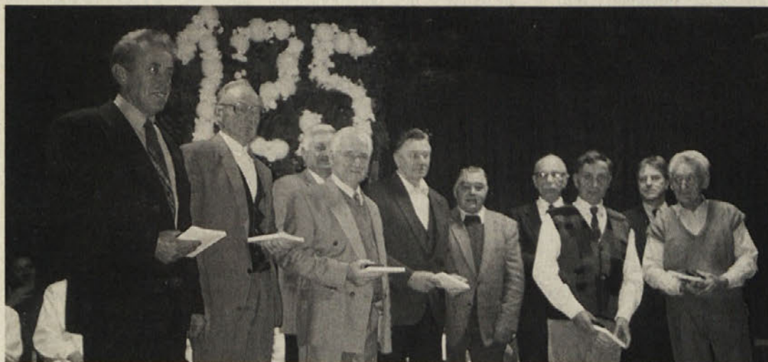
Zaslužni odborniki Posojilnice-Bank Šentjakob