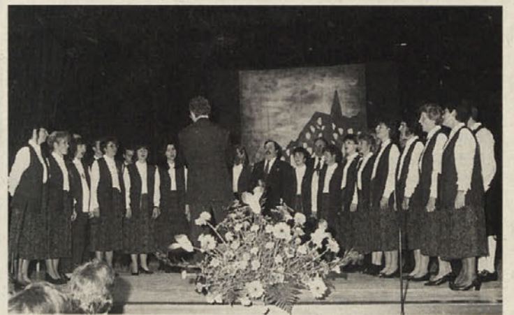
Mešani pevski zbor »Zarja« se je spet enkrat izkazal