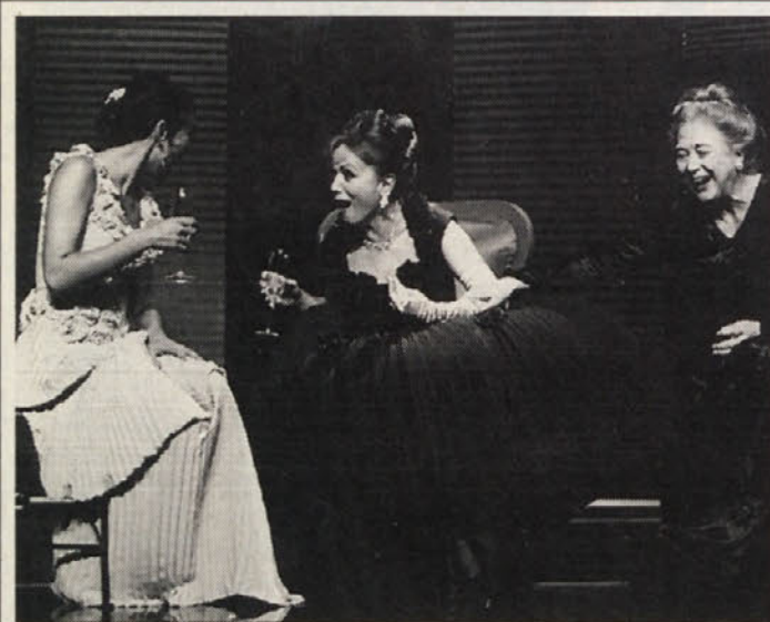
Krščanska kulturna zveza vabi na izlet v Ljubljano z ogledom gledališke predstave »Tri visoke ženske« v ponedeljek, 8. decembra '97. Cena: 250.- šil. (avtobus in predstava), 350.- šil. (avtobus, večerja in predstava) Informacije in prijave: KKZ, 10. Oktoberstr. 25/III, Celovec, tel. 0463/516243

Prijave na Dom v Tinjah najkasneje do 20. decembra!