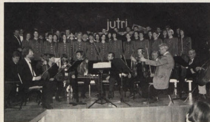
MePZ »Sele« in člani slovenske filharmonije pri svojem nastopu

Kot kaže, je uspelo najti primer-no pogodbeno obliko, kajti dvorana je bila obnovljena. Sanacija je uspela, počutje v dvorani je sedaj dosti bolj prijetno. Minulo