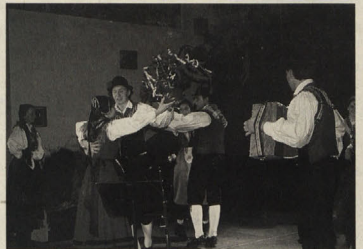
Kjerkoli nastopi, povsod navduši – žitajska folklor