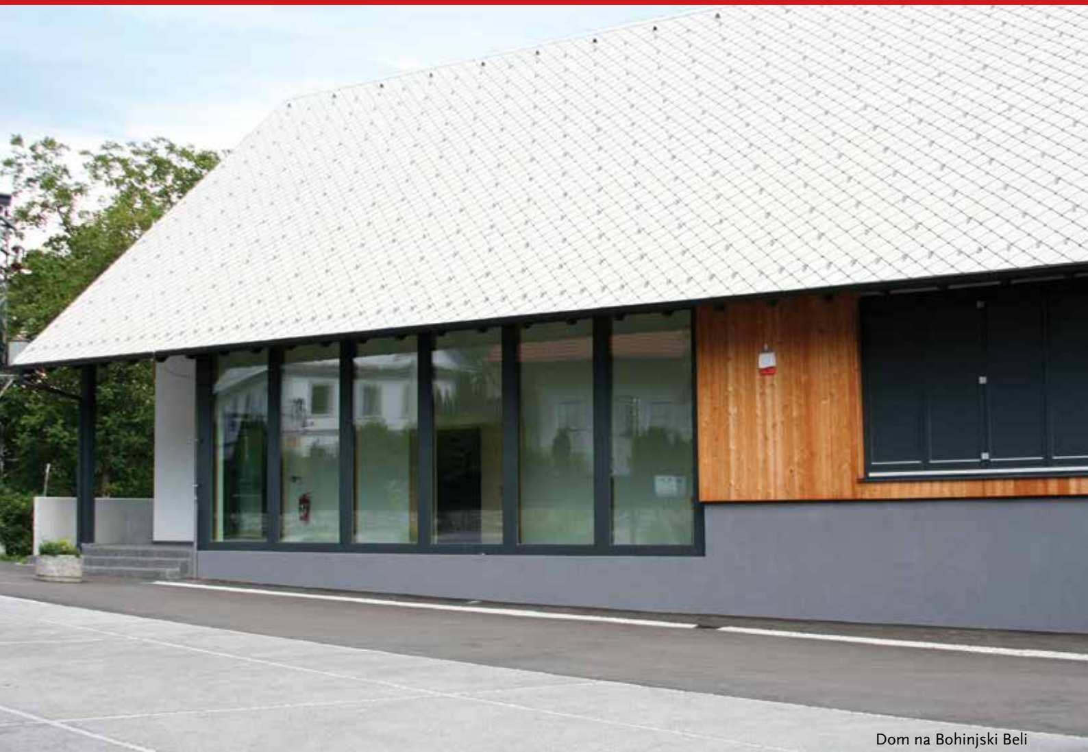
Dom na Bohinjski Beli