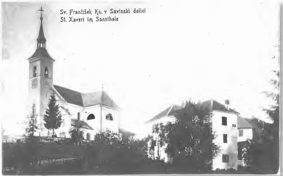
Razglednica Radmirja iz leta 1914.