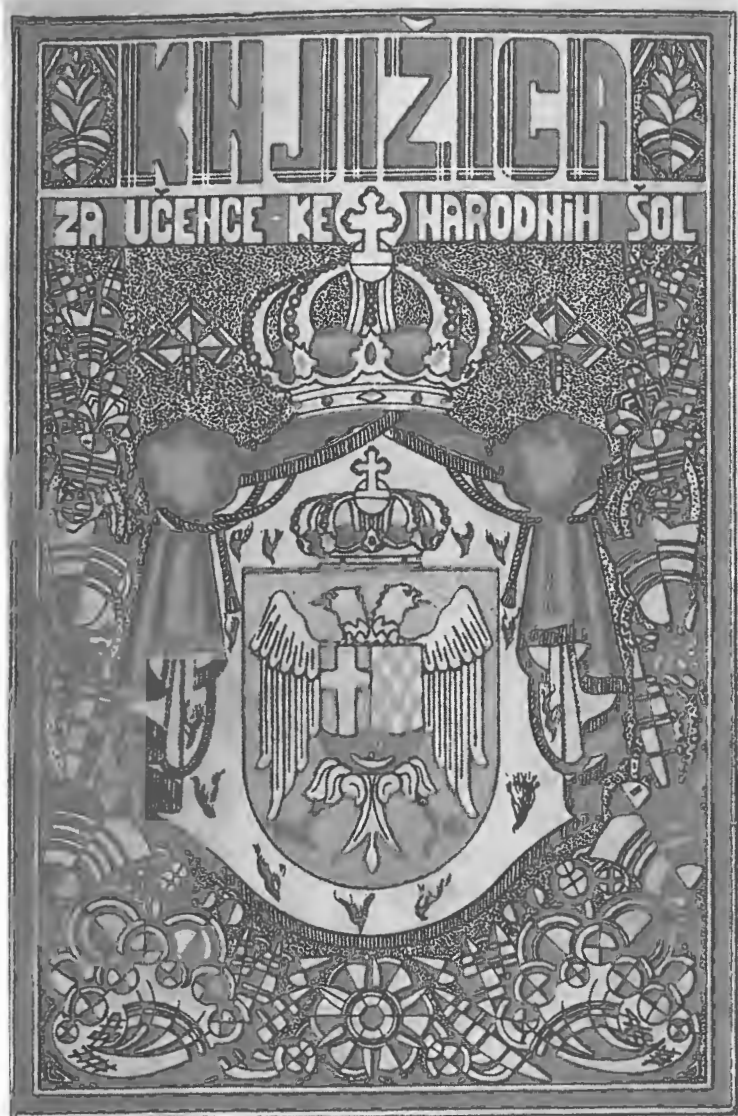
Naslikana stran spričevala iz leta 1934/35.