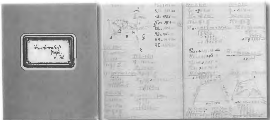
Naslovna stran šolskega zvezka nemške šole iz leta 1943.