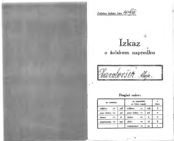
Naslovna stran spričevala iz šolskega leta 1934/35.