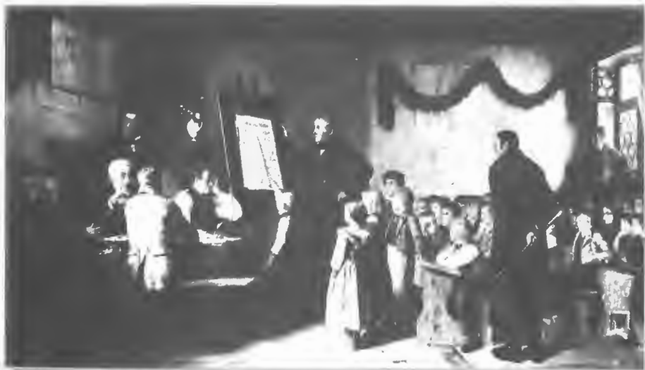
Šolska skušnja leta 1862. (Brošura Šolska spričevala, Slovenski šolski muzej, 1991).