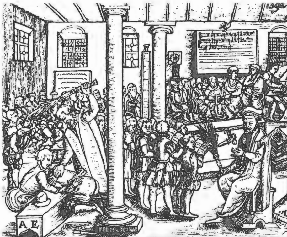
V šolskem razredu okrog leta 1500. (Brošura Šolska spričevala, Slovenski šolski muzej, 1991).