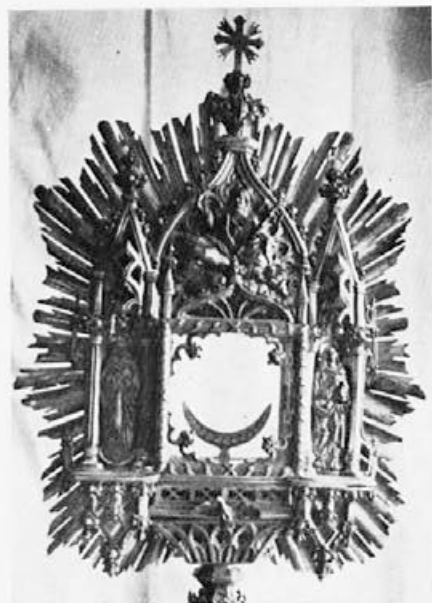
50 Karl Kleinod : Monštranca, nastavek, 1854, Slovenske Konjice, ž. c. sv. Jurija