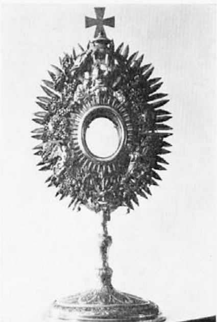
49 Mojster B. G. : Monštranca, 1807, Zavrč, ž. c. sv. Miklavža