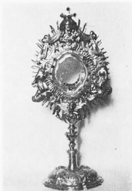
40 Matthias Pernhaupt : Monštranca, 40. leta 18. stoletja, Majšperk, ž. c. sv. Miklavža