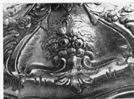
44 Anton Römer : Monštranca, detajl na nogi, 1775, Zgornja Ščavnica, ž. c. sv. Ane na Krembergu