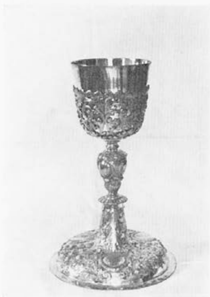
38 Mojster F. E. (Franz Emplmann?) : Kelih, konec 17. stoletja, Remšnik, ž. c. sv. Jurija