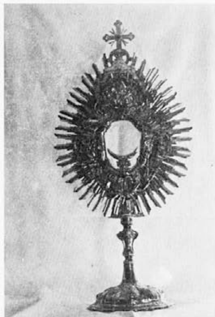
43 Anton Römer : Monštranca, 1775, Zgornja Ščavnica, ž. c. sv. Ane na Krembergu