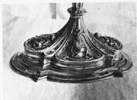
51 Karl Kleinod : Monštranca, noga, 1854, Slovenske Konjice, ž. c. sv. Jurija