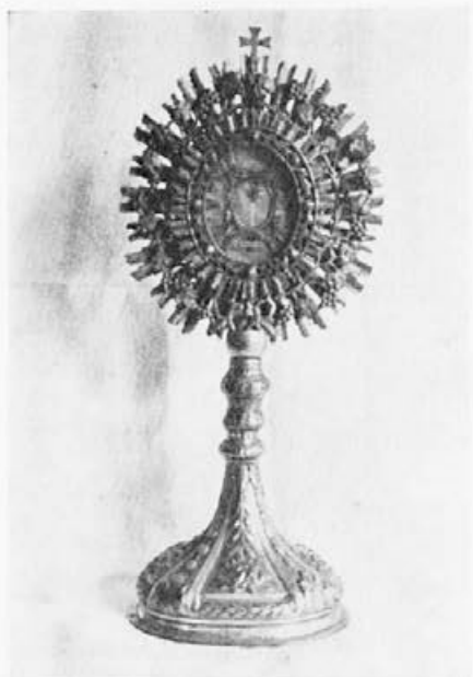
48 Neznan graški mojster : Relikviarij, konec 18. stoletja, Maribor, ž. c. sv. Janeza Krstnika