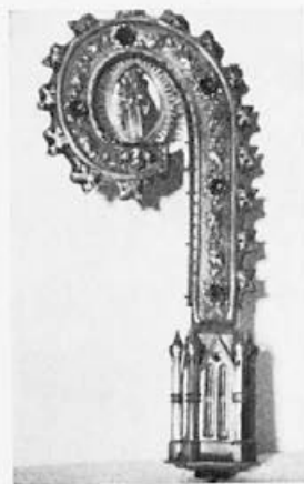
52 Carl Haas : Prozostva palica, 60. leta 19. stoletja, Ptuj, ž. c. sv. Jurija