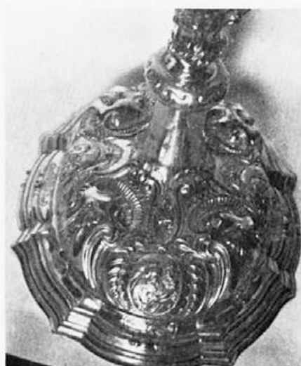
41 Matthias Pernhaupt : Monštranca, noga, 40. leta 18. stoletja, Majšperk, ž. c. sv. Miklavža