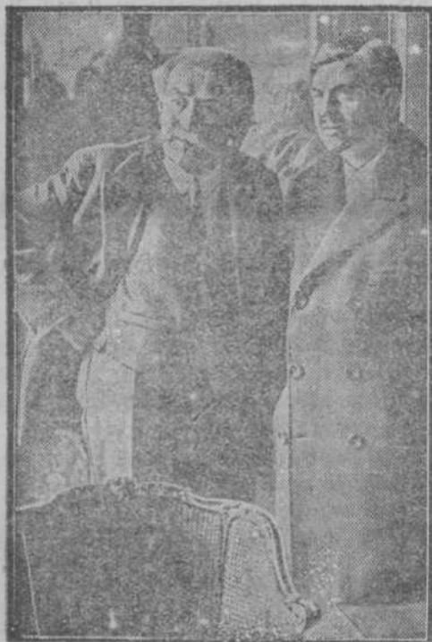
♦ Bivši dolgoletni francoski zunan. minister Briand (levo) in ministrski predsed. Laval (desno) ki je sedaj zunanji minister.

Poleg slike pokojnika prinašamo še sledede kratke podatke o možu, ki je bil svetovni slogaš.