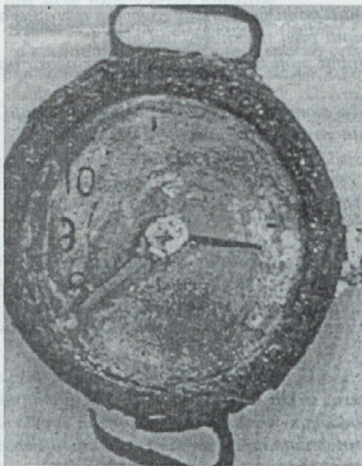
Ročna ura, ki se je ustavila v trenutku, ko je nad Hirošimo eksplodirala jedrska bomba

Drugič, Američani so bombardirali Japonce, toda bomba je bila namenjena predvsem Rusom. Z jedrsko bombo se je širjenje ruskega vpliva ustavilo in začela se je hladna vojna.