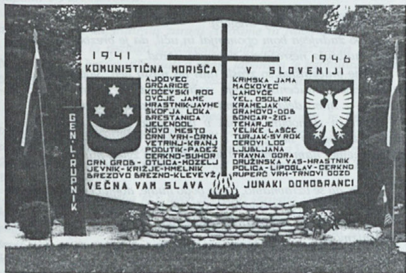
Spominska plošča vsem žrtvam komunističnih morij v Sloveniji. Slovenska pristava - Cleveland - ZDA

Kaj se je v Sloveniji med vojno in po njej v resnici dogajalo, to vprašanje se ponavlja doma vedno pogosteje in glasneje. Ko bo izgovorjena zadnja beseda in bo napisano poslednje poglavje, bo