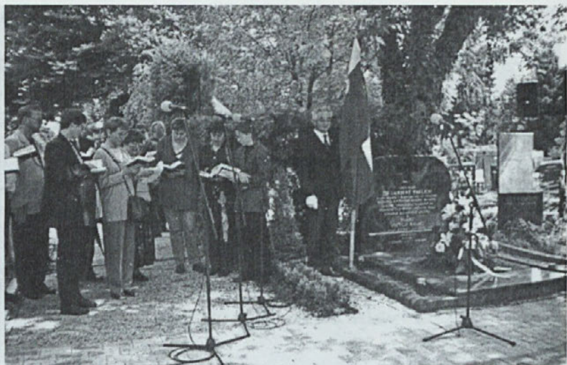
Ljubljana, Žale: Ob 55-letnici spomina na krvavi komunistični zločin

Vendar zgodovina bo tudi komunizmu, tej najbolj krvavi tiraniji pravičen sodnik.