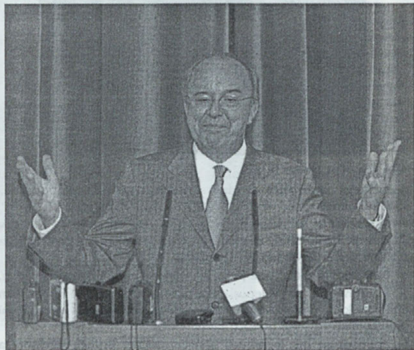
Dr. Andrej Bajuk — predsednik, kot se „šika“

Kljub temu, da je bil gospod Bajuk vrhunski strokovnjak v svetovnem bančništvu, kjer bi mirno lahko nadaljeval svoj posel, se je odločil, da vstopi v slovensko politiko, kajti njegova domovinska zavest je prevladala nad vsem ostalim. In ko je prišel med nas, sem si oddahnil. Zakaj? Prevezel je nase ključne odgovornosti v vodenju te države, kar mu, če bi bil človek cinične distance, kar ni, ne bi bilo treba. Ko danes spremljam to, kar ustvarja v demokratskem duhu na Slovenskem z vlado vred, ki jo je