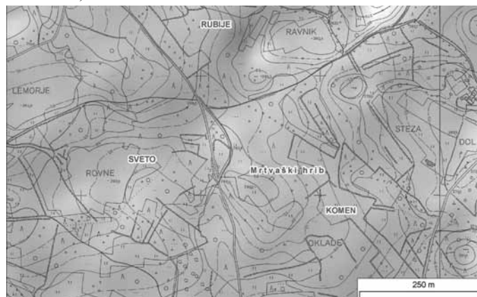
Slika 2: Mrtvaški breg na tromeji med Komnom, Gabrovico in Tomačevico. Mrtvaška počivala nastopajo pod različnimi ledinskimi imeni, kot so Križen drev, Mrtvaški breg, Mrtvaški hrib, Počivala itd.

vdorom sil z onstranstva. Pripovedi s Krasa in Istre govorijo o srečevanju prikazni, o klicanju hudiča na križiščih, na njih se bojujejo nadnaravna bitja, se zbirajo ali razkrivajo čarovnice, nanje je umeščena večina magičnih, očiščevalnih obredov, po izročilu se križišča mora blagoslavljeni itd. (Hrobat 2010a: 130-139). Na križišču oziroma ob sotočju dveh rek že Homer opravi obredno daritev, da se mu odpre podzemlje (Odiseja K-X, 512-518). Tudi Rómul naj bi v obredni utemeljitvi Rima daroval v grobnici na križišču dveh osi, cardo in decumanus, s čimer je bil Rim postavljen v središče sveta (Dragan 1999: 162; Segaud 2008: 110).