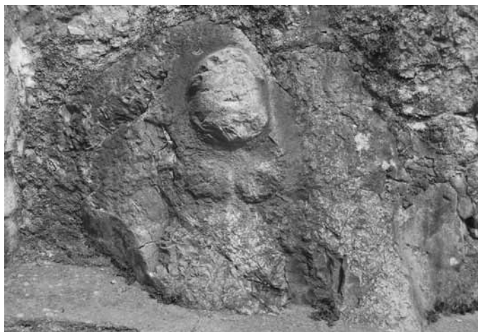
Slika 6: V živo steno vklesana Baba v podobi ženske na vhodu v mesto Grobnik, s katero so strašili otroke tako kot na Krasu, dokazuje, da se v kamnitih monolitnih babah resnično skrivajo ženski liki.