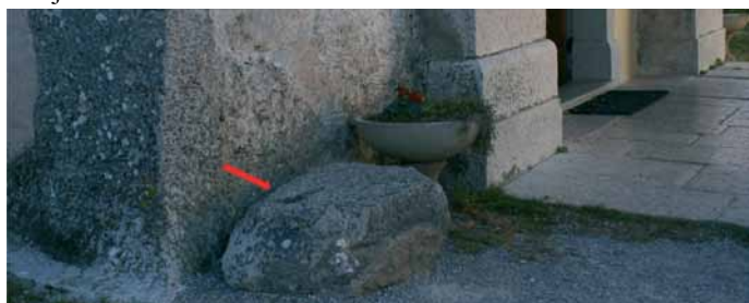
Slika 1: Na kamnu pred cerkvijo na Repentabru naj bi bila Marijina stopinja, s čimer naj bi nakazala, kje graditi cerkev.

1971: 98-108). Mejna črta pomerij, ki naj bi jo ob ustanovitvi mesta Rim obredno zoral mitični ustanovitelj Rómul, je bila prav tako religioznega pomena (Segaud 2008: 102, 121). Obredni vidik srenjskih mej se odraža v "mrtvaških počivalih" (Hrobat 2010a: 107-118; 2010b). Gre za posebna mesta na pogrebnih procesijah, torej na tistih poteh človeka, ki so najbolj pomembne v razločevanju dveh svetov, živih in mrtvih (Hrobat 2010a: 107-108). Ljudje iz pogrebnega spreveda so se tu ustavili, prekrizali, zmolili, menjali nosače krst in postavili mrliča na tla, kar drugje, z izjemo križišč, ni bilo mogoče zaradi nevarnosti kontaminacije sveta živih s smrtjo. Analiza je pokazala, da "mrtvaška počivala" ležijo ravno ob katastrskih mejah. Nekaj izjem je ob vodi, ki je podobno kot srenjska meja veljala za posrednika z onstranstvom (Mencej 1997). Podatek govori v prid hipotezi, da so v pomanjkanju površinske vode na Krasu vlogo vode kot prehoda v onstranstvo prevzele katastrske meje. S tega stališča postane razumljivo, da so se ravno na srenjskih mejah, kjer se že v folklori odpirajo prehodi v onstranstvo, odvijale obredne dejavnosti. "Mrtvaška počivala" je mogoče razumeti v kontekstu obredov prehoda, prekoračitve, ki so po van Gennepovi teoriji (1977) del tradicijskega koncepta mej in omogočajo prehode med različnimi socialnimi statusi, teritorialnimi in časovnimi stanji.