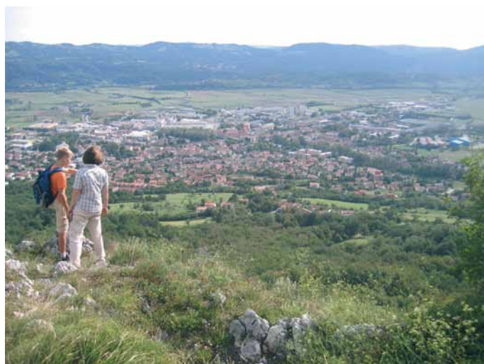
Slika 7: Na Stari Babi nad Šturjami nad Ajdovščino so še danes ostanki kresa, ki so ga tudi drugod zažigali ob monolitnih babah.

Figure 6: There is a Baba in the image of a woman chiselled out of a solid rock wall at the entrance to the town of Grobnik which was used to frighten children, the same as in the Karst region, which proves that stone monolithic "babas" truly conceal female figures.