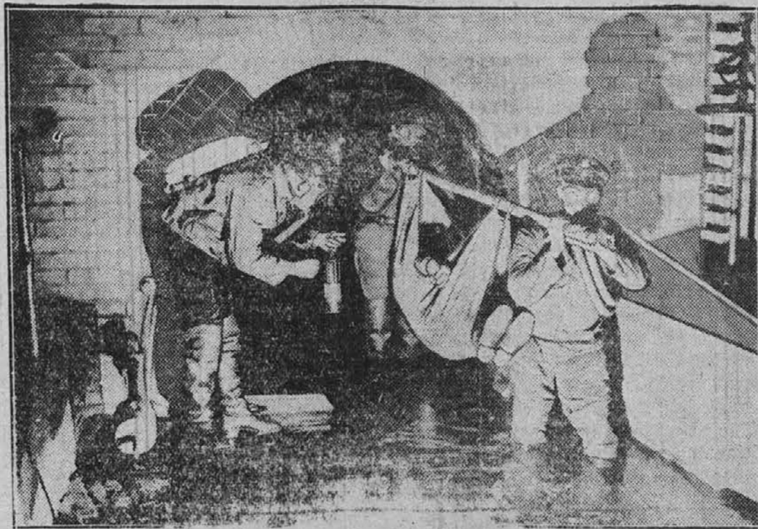
V mestu Düsseldorf, Nemčija, grade podzemne ceste, katere se smatrajo za višek inženirstva. Je pa nasprotno delo pri teh cestah skrajno nevarno zaradi plinov. Gornja slika nam kaže dva delavca, ki neseta svojega tovariša, katerega je omamil plin kljub plinski maski.