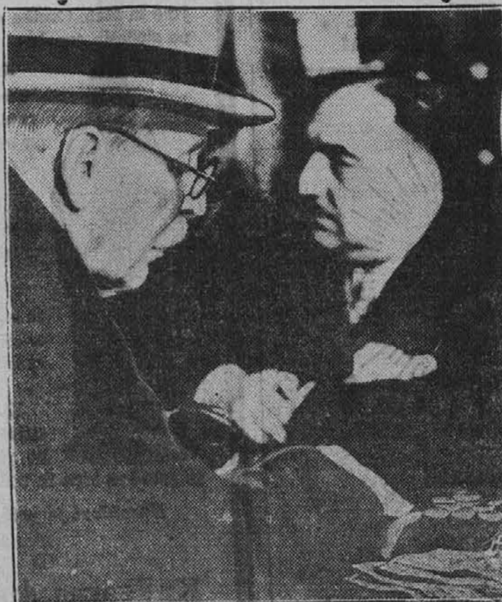
Na levi na sliki vidimo Samuela Insulla, ko si je dal v Istanbulu, Turčija, zamenjati svoj denar v ameriške dolarje, predno je nastopil prailno pot v Ameriko.