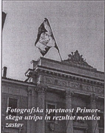
Fotografska spretnost Primorskega utripa in rezultat metalca zastav