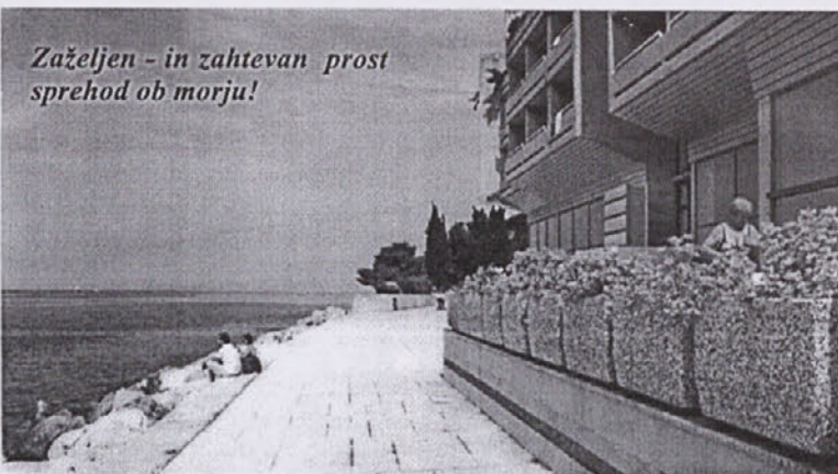
Zaželjen - in zahtevan prost sprehod ob morju!