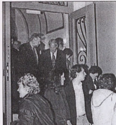
Dr. Dimitrij Rupel in Vojko Čok v gledališču.