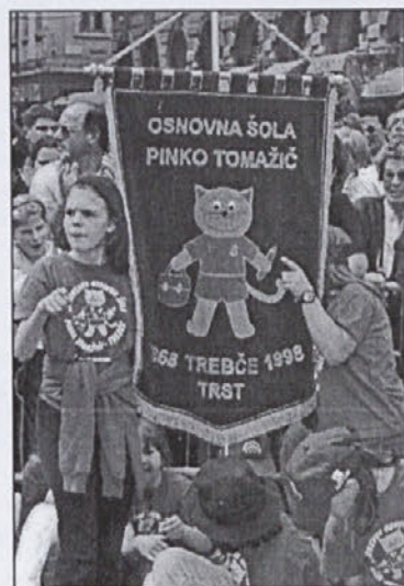
Učenci na manifestaciji

Mirjam Muženič