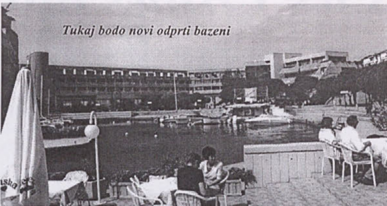
Tukaj bodo novi odprti bazeni