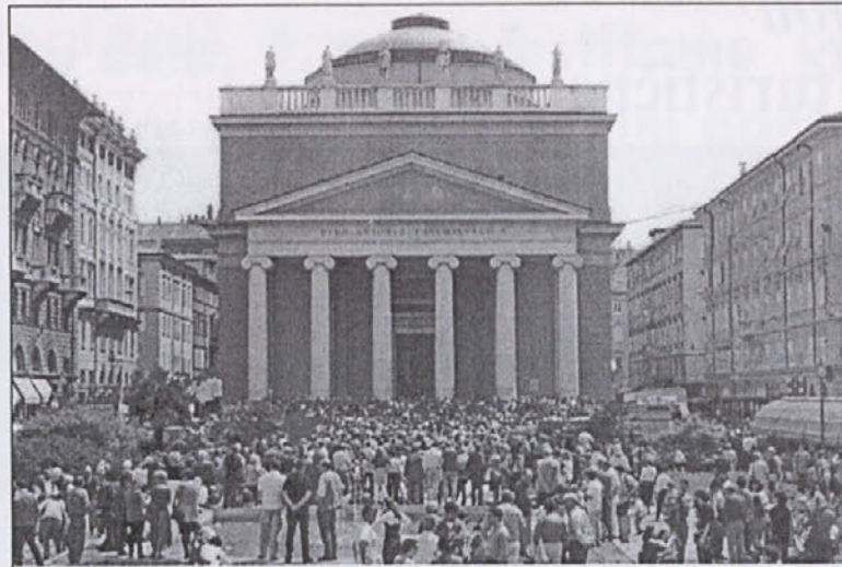
Cerkev Sv. Antona novega, pred katero je bila manifestacija, čeprav so jo želeli organizirati na trgu Unita