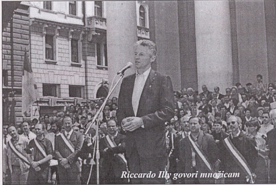
Riccardo Illy govori množicam

Okrog 3000 Slovencev iz celotne obsejne dežele od Trbiža do obmorskih Milj je v vročem dopoldanskem soncu v soboto, 6. maja 2000 preplavilo trg pred tržaško cerkvijo Svetega Antona novega v Trstu. Zbrali so se na pobudo svojih dveh krovnih organizacij, Slovenske kulturno gospodarske zveze in Sveta slovenskih organizacij ter ob pomoči občine Trst pripravili veliko javno manifestacijo, na kateri so z besedo, glasbo in plesom italijanski javnosti in državi sporočili svojo soglasno zahtevo po sprejemu zaščitnega zakona. Iz grl 300 pevcev združenega zbora je zadonela slovenska pesem. Bila so jasna