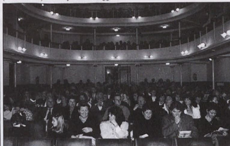
Markantna gledališka dvorana: prvi sedeži za imenitne goste so bili prazni.