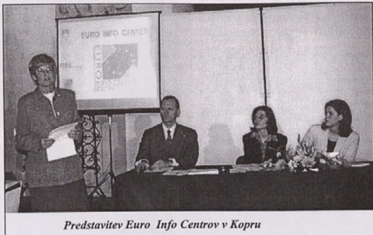
Predstavitev Euro Info Centrov v Kopru

Euro Info Center je že član mreže Euro Info Centrov in deluje v okviru Pospeševalnega centra za malo gospodarstvo. Euro Info Center v Kopru pa bo s podpisom pogodbe iz Bruslja uradno začel delovati v okviru Znanstvenega raziskovalnega centra v Kopru v Santorijevi 7. Kot že rečeno je osnovna naloga EIC v Sloveniji informiranje podjetij o Evropski uniji, Evropski komisiji in njenih ustanovah, o zakonodaji,