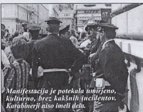
Manifestacija je potekala umirjeno, kulturno, brez kakšnih incidentov. Karabinerji niso imeli dela.

dvojezična sporočila. Po naši oceni je bilo na manifestaciji okrog 3000 udeležencev. Mednje je po krajši zamudi prišel med Slovence (bilo je tudi veliko Italijanov) gostitelj, tržaški župan Riccardo Illy (na sebi ni imel uradne lente) in jim povedal kako je prepričan, da bi se s sprejemom zaščitnega zakona dobri in ustvarjalni odnosi med