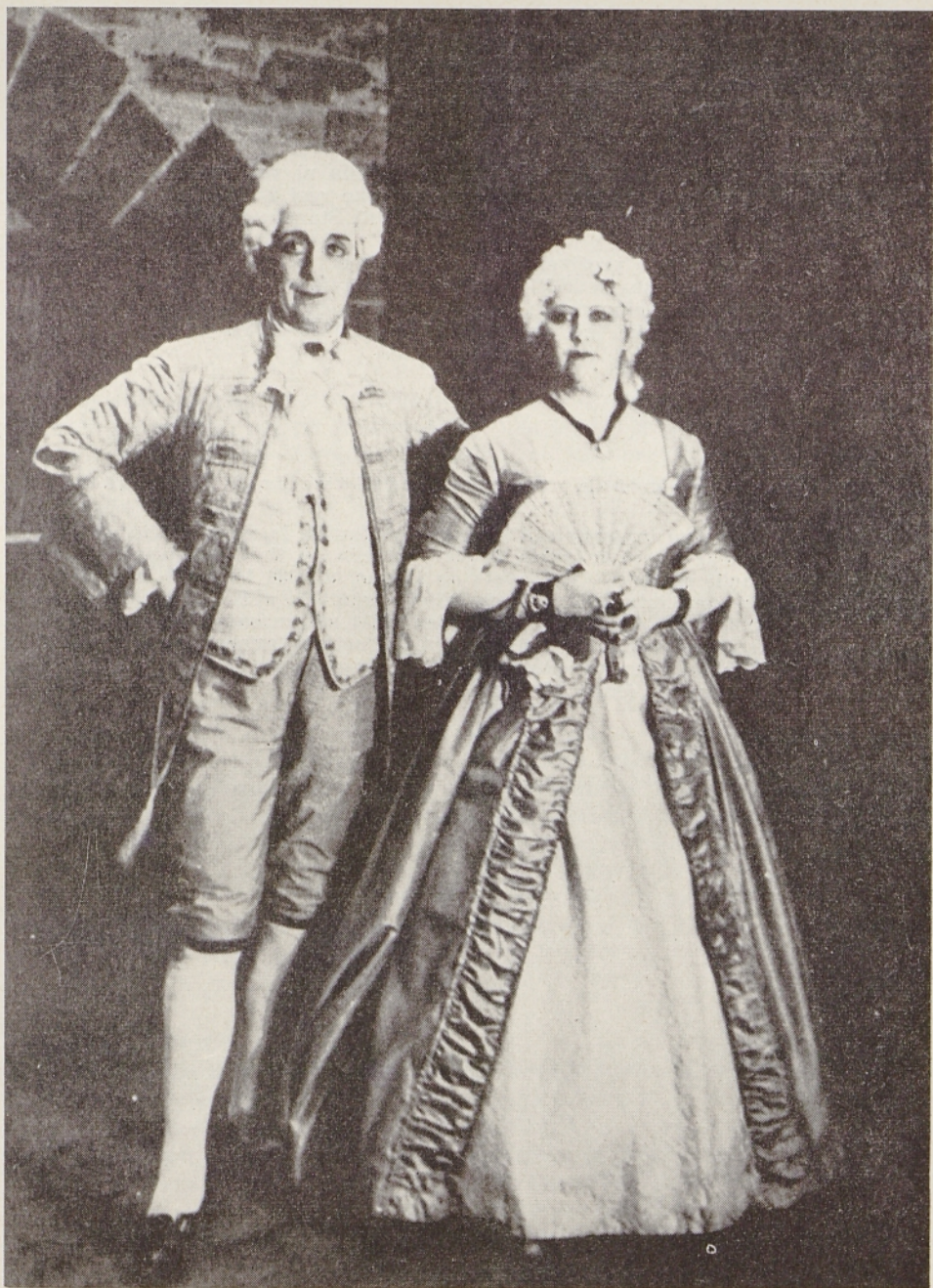
»Matiček« (Levar in Nablocka)