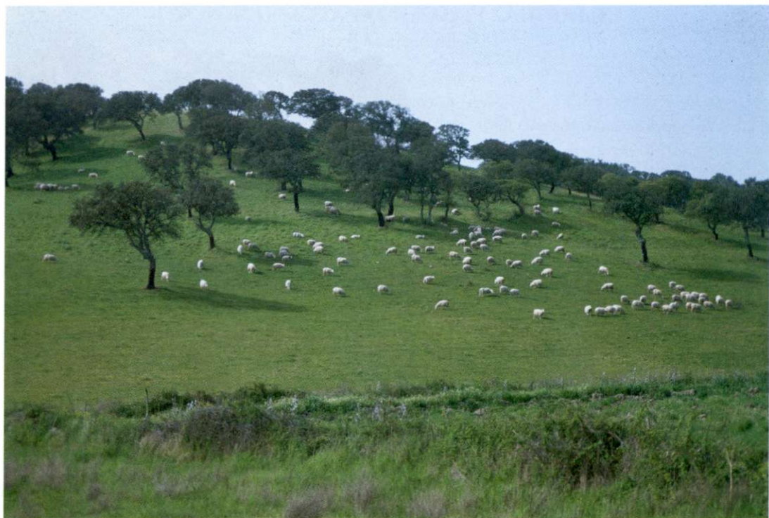
Slika 2: Sardinija predstavlja tisti del Italije, kjer se pase največ ovac in kjer je največ hrasta plutovca.