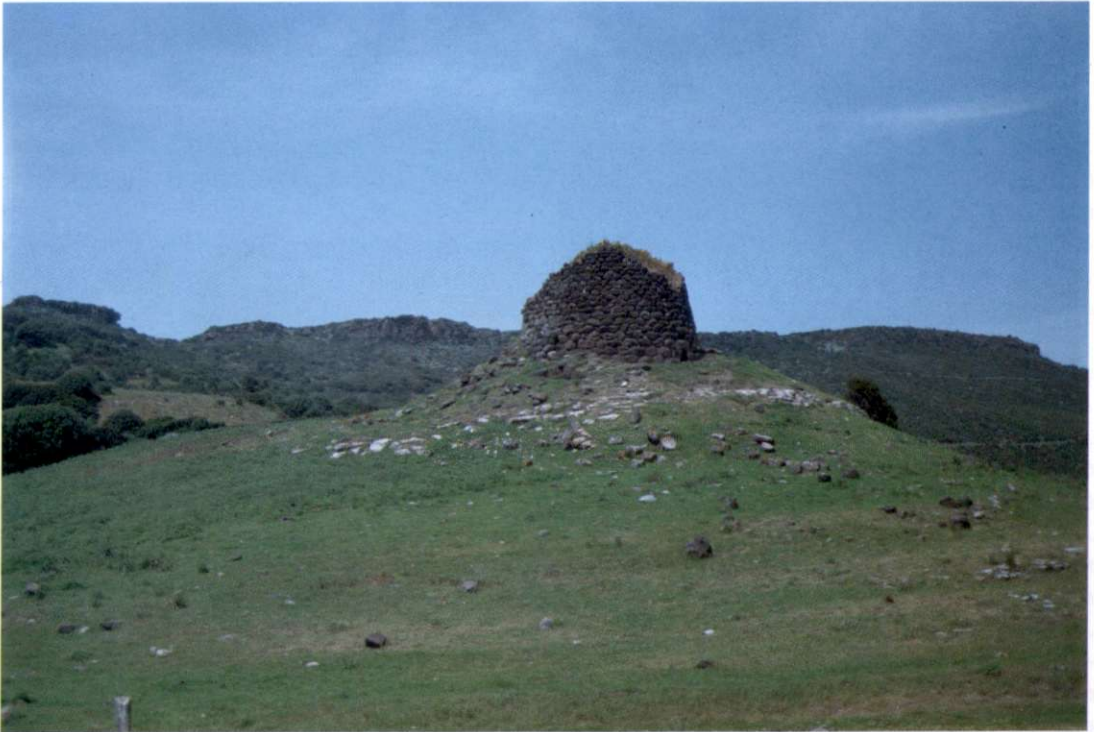
Slika 3: Kamniti stolpi "nuraghi" so ostanek skrivnostne nuraške civilizacije, ki se je razcvetela na otoku še pred prihodom Rimljanov. Funkcija teh stolpov še do danes ni povsem pojasnjena.

Po letu 1960 pa je sledil največji val, ki je dosegel svoj vrh v letih 1961-62 in 1967-68. Od-