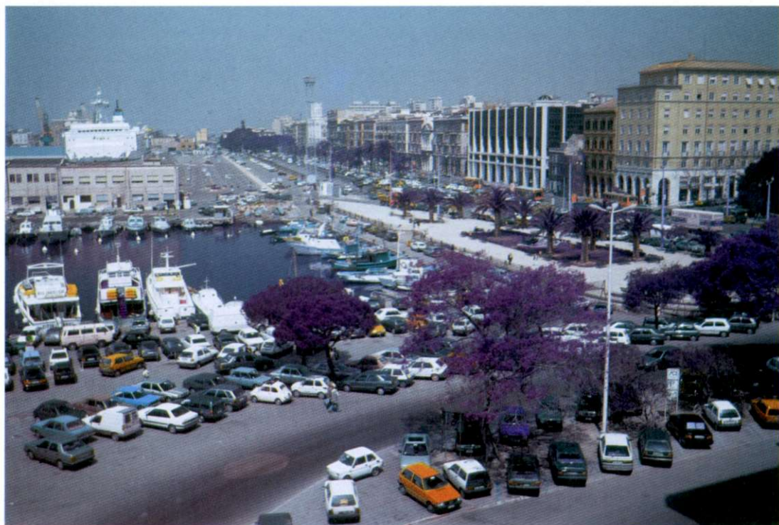
Slika 6: Cagliari je prestolnica Sardinije. Z 220 000 prebivalci je to obenem tudi njeno največje mesto. Na sliki vidimo osrednji del mesta z delom pristanišča in glavno mestno žilo (Via Roma).

1962 pa je v sardinsko kmetijsko okolje prišel še en nov tuj element. To so bili "Tunizijci". Gre za doseljence iz Tunizije, ki pa so bili italijanskega rodu. Ko so v Tuniziji nacionalizirali njihovo zemljo, so prišli na Sardinijo, kamor so prinesli svoje bogate izkušnje s področja namakalnega poljedelstva (4).