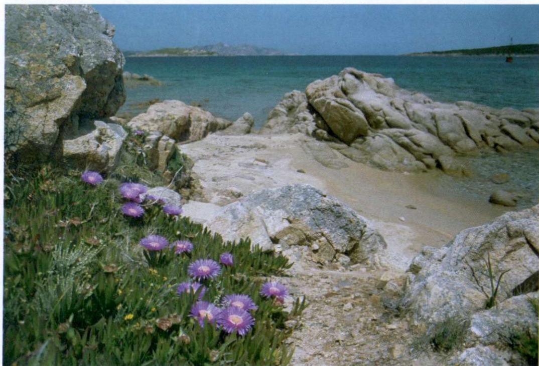
Slika 4: Kristalno čisto morje in edinstvena obala na znameniti Costi Smeraldi predstavljata le del turistične ponudbe na tem območju luksuznega turizma.

Poljedelstvo je tesno povezano z namakanjem. Prevladujejo mali posestniki, ki zemljo obdelujejo