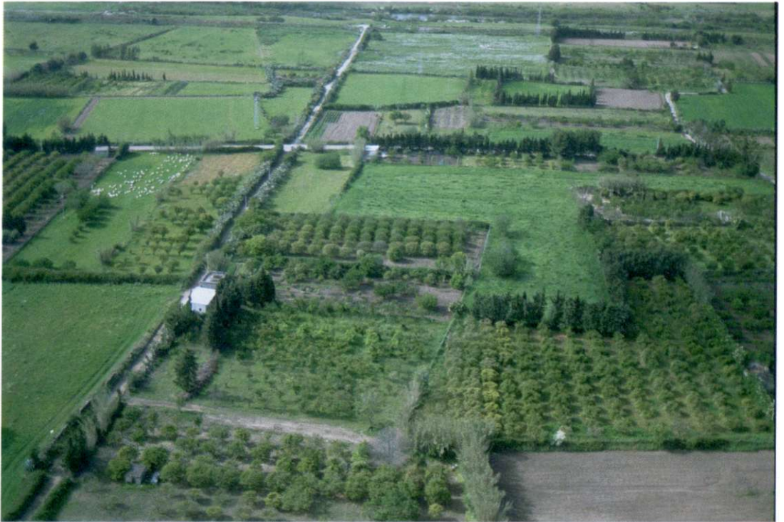
Slika 5: Izraz "coltura mista" pomeni sredozemsko poljedelstvo z mešanimi kulturami. Nanj naletimo tudi ponekod na Sardiniji, čeprav so za poljedelstvo primerne ravne površine dokaj redke.

sami. Poljedelske kulture so odvisne od lokalnega podnebja in razpoložljive vode. Na namakalnih območjih so običajne kulture agrumi, paradižnik, artičoke, sladkorna pesa, rože in tobak. V ravninskih predelih, ki jih ne namakajo, prevladujejo žita (pšenica, ječmen, oves). Največ jih je v ravnini Campidano in gričevnati okolici. Za gričevnata območja sta značilni vinska trta in oljka. Trto gojijo skoraj povsod. Večja koncentracija je v okolici Cagliarija in na pobočjih ugaslega vulkana M. Ferru. Najbolj znana sardinska vina so vernaccia, cannonau, malvasia in vermentino di Gallura. Največ oliv pridelajo severno od Sassarija.