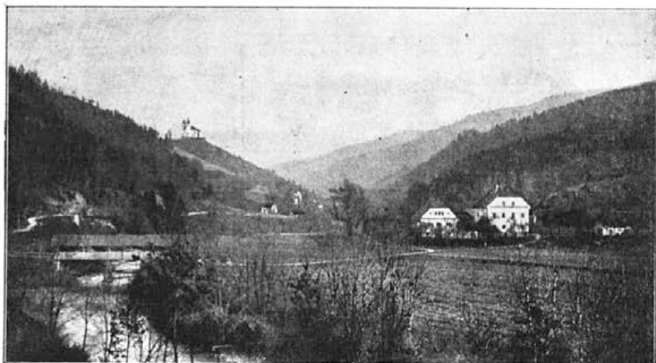
Tavčarjev dvorec Visoko

In ta domača slovenska zemlja, ki jo je blagi pokojnik tako presčno ljubil, je sprejela dne 23. februarja ob 11. uri dopoldne na Visoko