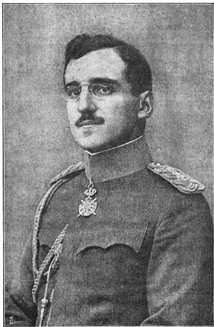
Kralj Aleksander I.