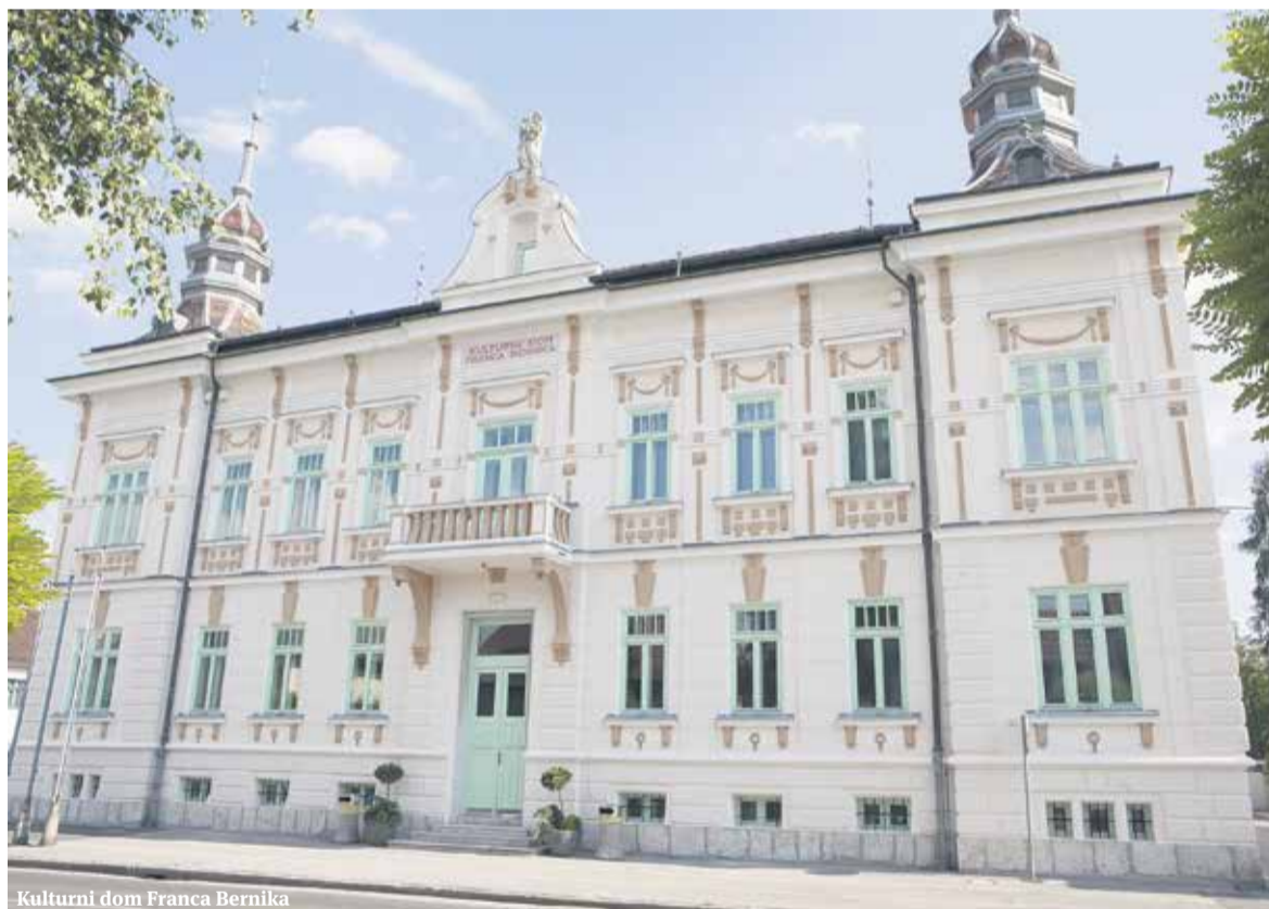
Kulturni dom Franca Bernika

Predvidoma v novembru bo odprt nov trgovski center Količevo na Viru nasproti tovarne Tosama. Objekt modernega izgleda gradi podjetje FMZD, d. o. o., ki je z gradnjo začelo spomladi 2016. Največja trgovina v tem centru bo Spar, ki se bo razprostiral na 2000 m 2 in imel še dodatnih tisoč kvadratnih metrov za skladišča. Gre za moderno živilsko trgovino, ki bo nudila široko izbiro artiklov. Z novim centrom v Domžale prihaja tudi trgovina Müller, kar verjamemo, da bo izjemno razveselilo domžalske dame. To bo edina trgovina v dveh etažah in se bo razprostirala na tisoč kvadratnih metrih. V trgovskem centru bodo tudi trgovine C&A, Deichmann in še mnoge druge. Prav tako bo poskrbljeno za osvežitev, saj bodo uredili dve novi kavarni. Poskrbljeno bo tudi za parkiranje, prav tako pa bomo dobili novo krožišče in novo urejen uvoz na regionalno cesto Želodnik-Domžale. Sodoben trgovski center bo tako izrazito izboljšal vzhodno silhueto mesta Domžale.