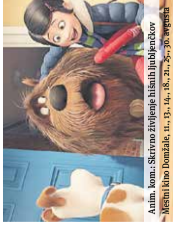
Anim. kom.: Skrivno življenje hišnih ljubljenčkov Mestni kino Domžale, 1., 13., 14., 18., 21., 25., 30. avgusta