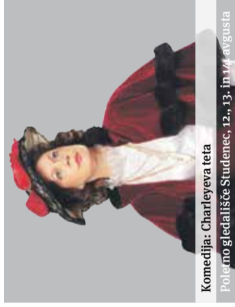
Komedija: Charleyeva teta Poletno gledališče Studenec, 12., 13., 13. in 14. avgusta