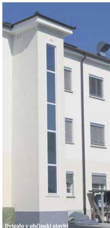
Dvigalo v občinski stavbi