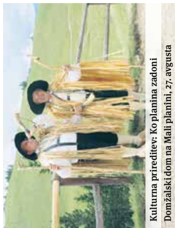
Kulturna prireditev: Koplanina zadoni Domžalski dom na Mali planini, 27. avgusta