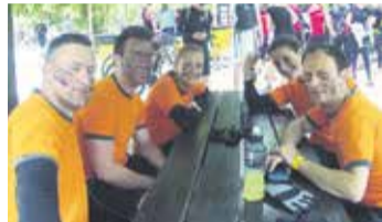
Člani ŠD Preserje pred štartom na Legionarju

Člani Športnega društva Preserje so se v nedeljo, 5. junija 2016, udeležili izziva Legionar Challenge, ki je tudi letos tradicionalno potekal v Ljubljani, natančneje v Mostecu. Gre za izziv, kjer udeleženci tečejo čez hribovit teren ljubljanskega Rožnika in ob tem premagujejo različne (vojaške) ovire.