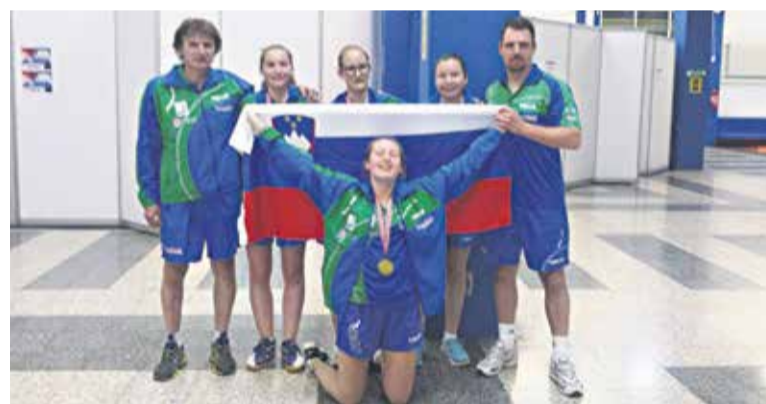
Veseli po osvojitvi bronaste medalje na letošnjem Evropskem mladinskem namiznoteniškem tekmovanju v Zagrebu.