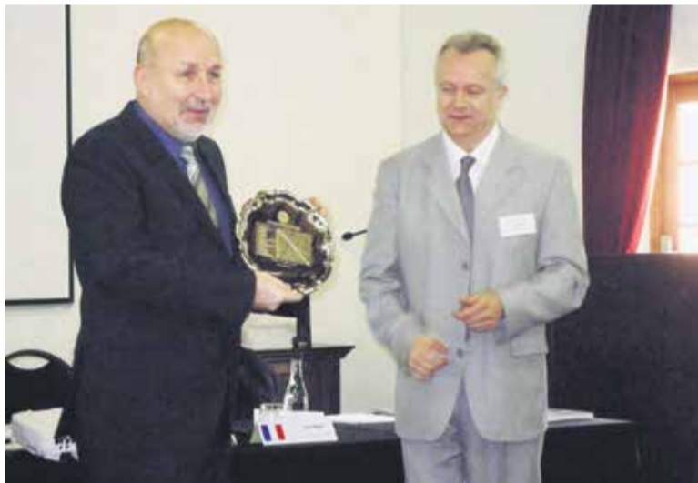
Na podelitvi naziva svetovnega prvaka v dopisnem šahu leta 2012 v Johannesburgu v Republiki Južna Afrika.

Po uvrstitvi v najboljšo jugoslovansko ligo nas je sprejel prvi mož občine. Še dve leti sem igral za domžalski klub, ker pa nisem uspel priti v prvo člansko ekipo, sem prestopil v Svobodo Ježica, kjer so med drugi-