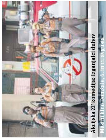
Akcijna ZF komedija: Izganjalci duhov Mestni kino Domžale, 6. in 11. avgusta