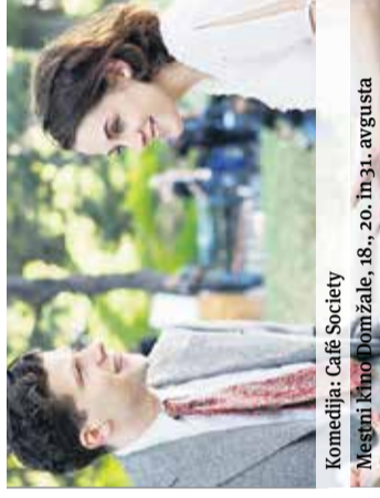
Komedija: Café Society Mestni kino Domžale, 18., 20. in 31. avgusta