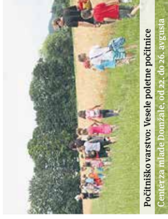
Počitniško varstvo: Vesele poletne počitnice Center za mlade Domžale, od 22. do 26. avgusta