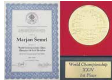
Diploma in medalja za svetovnega prvaka