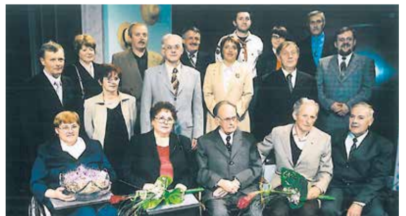
Podletvi naziva častni občan Občine Domžale leta 2003

Skrbno spremlja aktualna dogajanja, tako z branjem časopisa kot gledanjem televizije. Tudi v pogovorih s prijatelji pove, da ni zadovoljen z razmerami. Motijo ga nenehni prepri, za katere sicer pravi: »Bodo že