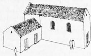
Sl. 5 Rekonstrukcija notranjščine starokrščanske cerkve v Spodnji Hajdini pri Ptujju. (Po W. Schmidu).

Pri izkopavanju rimskega foruma stare Poetovie na Spodnji Hajdini so poleg razrušenega Jupitrovega svetišča našli temelje starokrščanske cerkve. Kristjani so verjetno v dobi verske svobode razušili Jupitrov hram in njegovo zakladnico in iz njunega kamena na istem mestu sezidali svojo cerkev (sl. 5.). Sestavljala jo je pravokotna ladja brez preddvorja, apsido pa je v pravokotnem prezbiteriju nadomeščala polkrožna kamenita klop za duhovščino. Prezbiterij je od ladje ločil slavolok s korno pregrado. Cerkevni tlak je bil sestavljen iz marmornatih plošč; stene svetišča so bile rdeče in rumeno pobarvane, strop pa je bil lesen (sl. 2). Vzhodno od prezbiterija sta bila zunaj prizidana še dva prostora, nekaki zakristiji: prothesis — prostor za darila in zakladnica, in diakonikon — zbirališče duhovnikov. (Sl. 3.) Profesor W. Schmid postavlja to cerkev na začetek razvoja cerkvenih stavb v alpskih deželah. Najbrž je bila sezidana takoj po l. 515., verjetno na mestu, kjer je umrl mučeniške smrti sv. Viktorin.