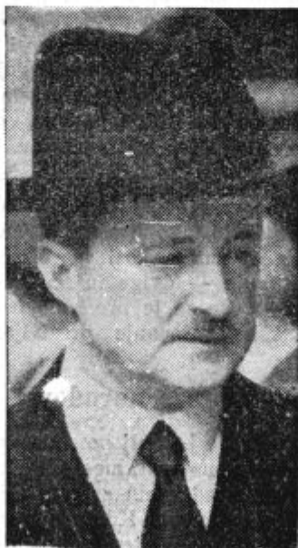
Bivši angleški mornariški minister Duff Cooper, ki je v protest proti Chamberlainovi politiki odstopil. Kancelar Hitler meni, da bi izbruhnila vojna med Anglijo in Nemčijo, ako bi ta mož prišel v Anglijo na krmilo.

Posebna delegacija pod vodstvom ministra Tisa je s sprejetimi zahtevami že odpotovala v Prago. Splošno računajo, da bo osrednja vlada v najkrajšem času pristala na federativno pre-