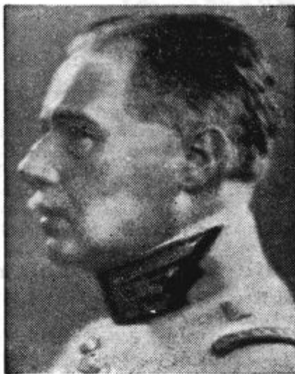
Načelnik francoskega generalnega štaba general Gustav Gamelin bi bil vrhovni poveljnik francosko-angleške vojske, ako bi bila pred nedavnim izbruhnila vojna.

Končno zahtevajo žilinski sklepi, naj pridejo vsa državna podjetja na slovaškem ozemlju pod upravo slovaške vlade in naj se sedanji državni proračun CSR po posebni komisiji raz-