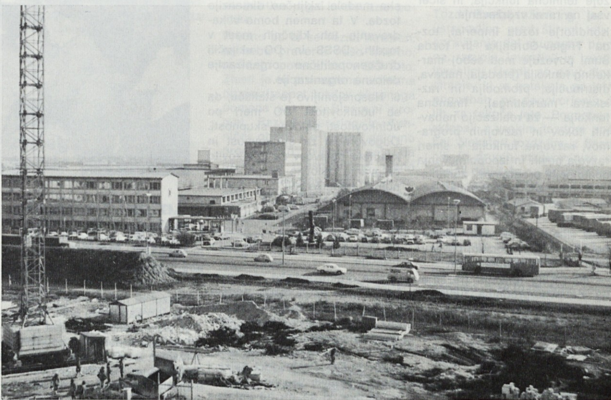
Sedež Živilskega kombinata Žito, Ljubljana, ob Šmartinski cesti 154 v Mostah, kjer so sledeče temeljne organizacije: Mlini, Šumi, Pekarne z delovno enoto Pekatete, trije tozdi skupnega pomena: Blagovni promet, Razvoj-inženiring in Tehnični obrati ter Delovna skupnost skupnih služb.

Neučinkovitost oz. neurejenost celotnega spleta samoupravnih odnosov med tozd v DO Žito, ne kaže iskati zgolj v večji ali manjši odgovornosti poslovnih delavcev, v delovanju samouprave in še posebej komunistov na ravni delovne organizacije, temveč predvsem v še neuveljavljenem položaju delavca v tozdih. Načelno sprejemanje skupnih ciljev ob hkratnem uresničevanju in zasledovanju zgolj lastnih interesov je lažno slogaštvo in prikriti oportunitizem, ki ne zagotavlja kvalitativnih izhodišč, da hitreje požene kolo razvoja.