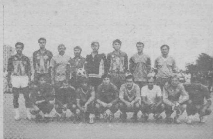
Na sliki sta finalista turnirja Mercator Sadje-zelenjava 88 na Fužinah ekipi KMN Vukosavljevič in Šaljivci

Besedilo: DUŠAN STOJČIČ-STOLE