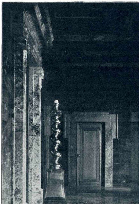
Plečnikova šola (arh. Fr. Tomažič), veža I. nadstr. palače Zbornice za TOI v Ljubljani

Formalne in estetske možnosti so že pri primitivni menjavi tona s pavzo, njega ponavljanja, dinamiziranja, ritmiziranja neštivilne. Še važnejše sredstvo od teh je morda — menjava tonske