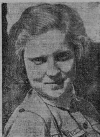
Članica ženske organizacije na Finskem, katera je prevzela postrežbo vojaških bolnikov in oskrbo flinskih čet z raznimi potrebščinami

Pri parlamentarnih volitvah v decembru 1938 so napravili vratolomni skok prek plota v tabor tistih, ki so jih med diktaturo kot separatiste in državi sovražne elemente preganjali z ognjem in