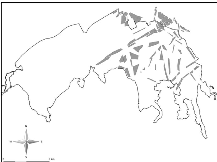
Slika 4: Območje razširjenosti kanadske zlate rozge ( Solidago canadensis ) na vzhodni polovici Ljubljanskega barja leta 2011 (obris je meja krajinskega parka).