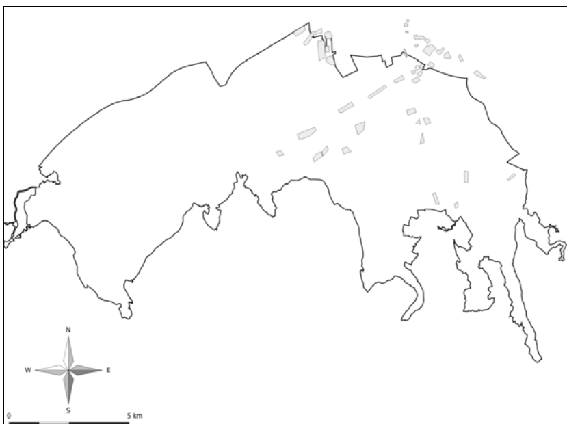
Slika 3: Območje razširjenosti kanadske zlate rozge ( Solidago canadensis ) na vzhodni polovici Ljubljanskega barja leta 2001 (obris je meja krajinskega parka).