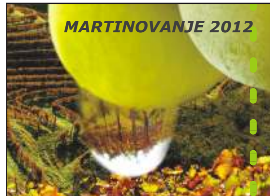
Stran 16: Martinovanje