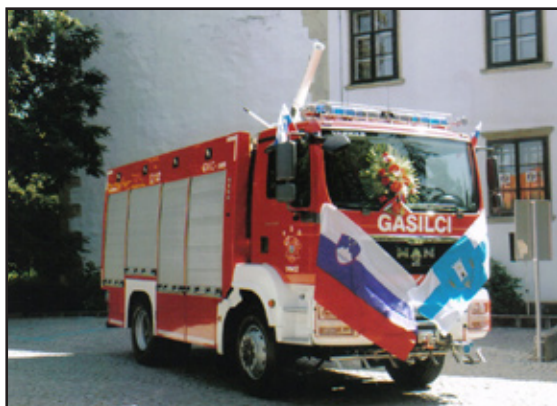
Stran 2: Nov avto za ormoške gasilce