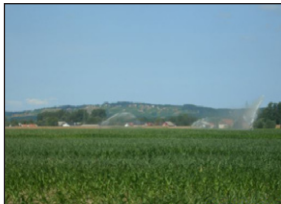
Stran 4: Odprtje namakalnega sistema