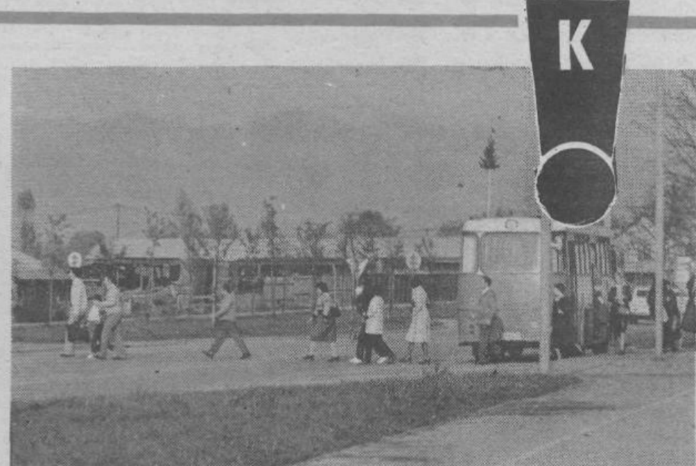
Prečkanje čez Litjsko cesto nad podhodom v Vlahovičevu ulico. Naglica časa? Izzivanje nesreče? Ignoriranje predpisov — tu ni prehoda za pešce!