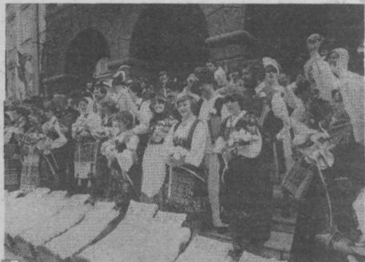
Predpočitniška prireditev v Ljubljani: Kmečka ohcet '81