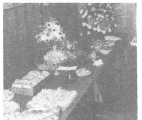
Domače slaščice na razstavnem prostoru: »Tudi z malo denarja se da pripraviti kar lep prigrizek«.

Pač »Zvedel sem nekaj novega«, bi najbrž lahko rekel prenekd iz prepolne dvorane, in to staro lepo pesem je v kulturnem delu prireditve z izbrušenimi profesionalnimi glasovi zapel tudi kvartet Glasbene šole Vič. Dobrih starih slovenskih pesmi je bilo še več; kakor ni manjkalo tudi plesov (v izvedbi folklorne skupine OŠ Marjan Novak-Jovo) in preprostih otroških igrice (kot na