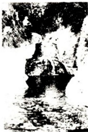
Mirtoviški potok lahko postane ena od znamenitosti naše doline

programe. Zaradi izjemno težkega terena vse naše vasi niso sprejemale RTV signala. Zato je letos 50 gospodinjstev dobilo brezplačno priključitev na satelitske programe, kjer lahko spremljajo TV program v slovenskem jeziku.