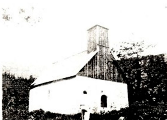
Cerkev pri Sv. Ani je ena naših kulturnih znamenitosti, ki si jo turisti radi ogledajo. Potrebna pa je temeljite obnove.