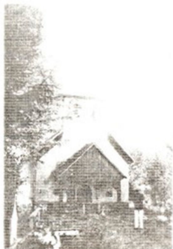
Cerkev in pokopališče v Pepežih

škarpa ob cesti na pokopališče in asfaltiran dostop do pokopališča.