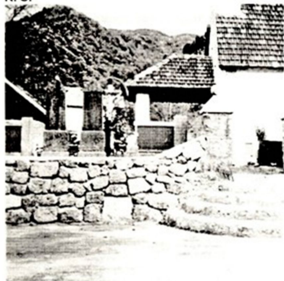
Pokopališče v Bosljivi Loki, ki smo ga "udarniško" uredili oktobra