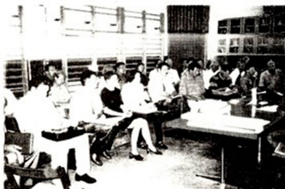
Z razprave o dokončanju ceste Kočevska Reka - Osilnica