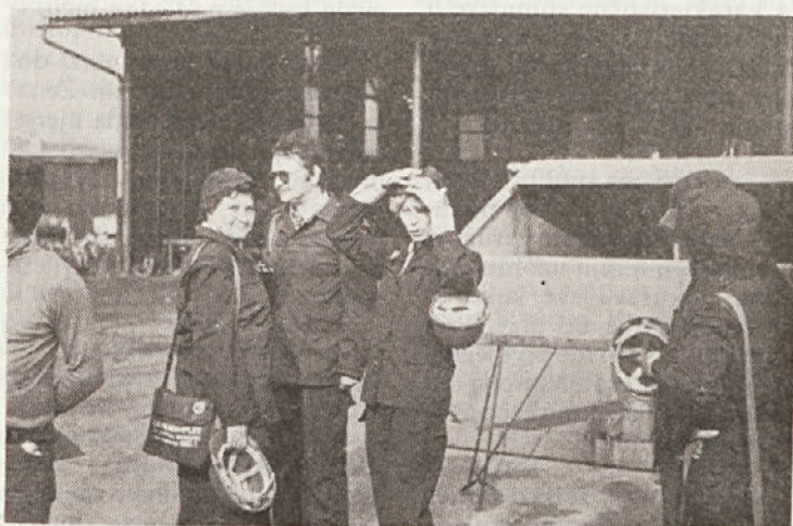
Po končani vaji.