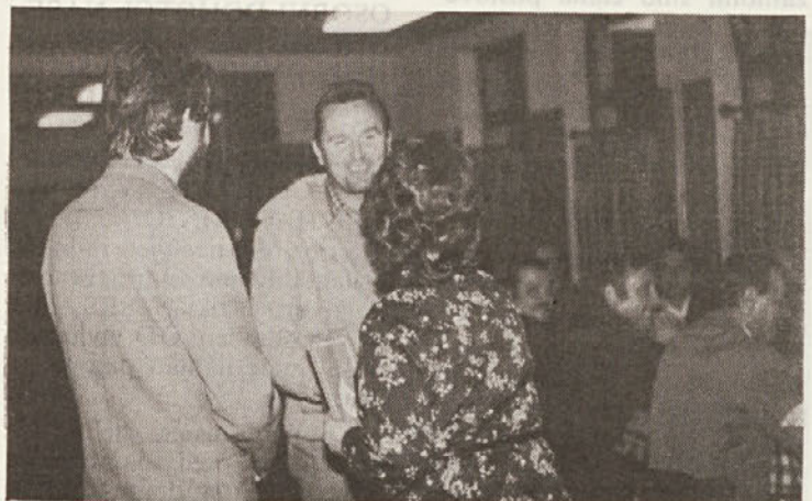
Bartolj iz TOZD Lesni obrat prejema priznanje za 20-kratno darovanje krvi.