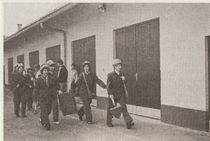
Splošna enota civilne zaščite.

Biološka dekontaminacija je uničenje ali odstranjevanje bioloških agensov in njihovih prenašalcev pa tudi razkrajanje toksinov na kontaminiranih površinah. Pri biološki dekontaminaciji uporabljamo že dobro znane metode: dezinfekcijo, sterilizacijo, dezinskcijo in derantizacijo.