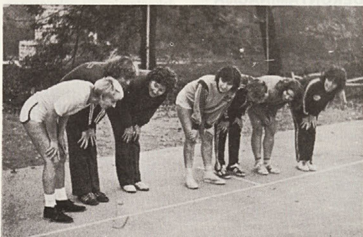
Še zadnji pozdrav naših odbojkaric na DŠI 83, kjer so dosegle 2. mesto. Moška ekipa ni sodelovala. Več o delovnih športnih igrah v naslednji številki, ko bodo znani rezultati še ostalih panog.

To smo stanje nazvali patološki matrijarhat u alkoholičarevoj obitelji; sudbinski utječe na sazrijevanje djece a i na uspjeh mogućeg liječenja, jer ako alkoholičara ne možemo u takvoj mjeri aktivirati da se može izboriti za svoju izgublenu poziciju („vlast je slast“ i nitko je ne predaje bez borbe) i preuzme svoju normalnu ulogu oca i muža, od liječenja neće biti ništa. Ali ta stvar nije jednostavna. Zbog toga što je morala u obitelji pored svoje uloge preuzeti i ulogu muža, alkoholičareva žena razvija svoje vlastite