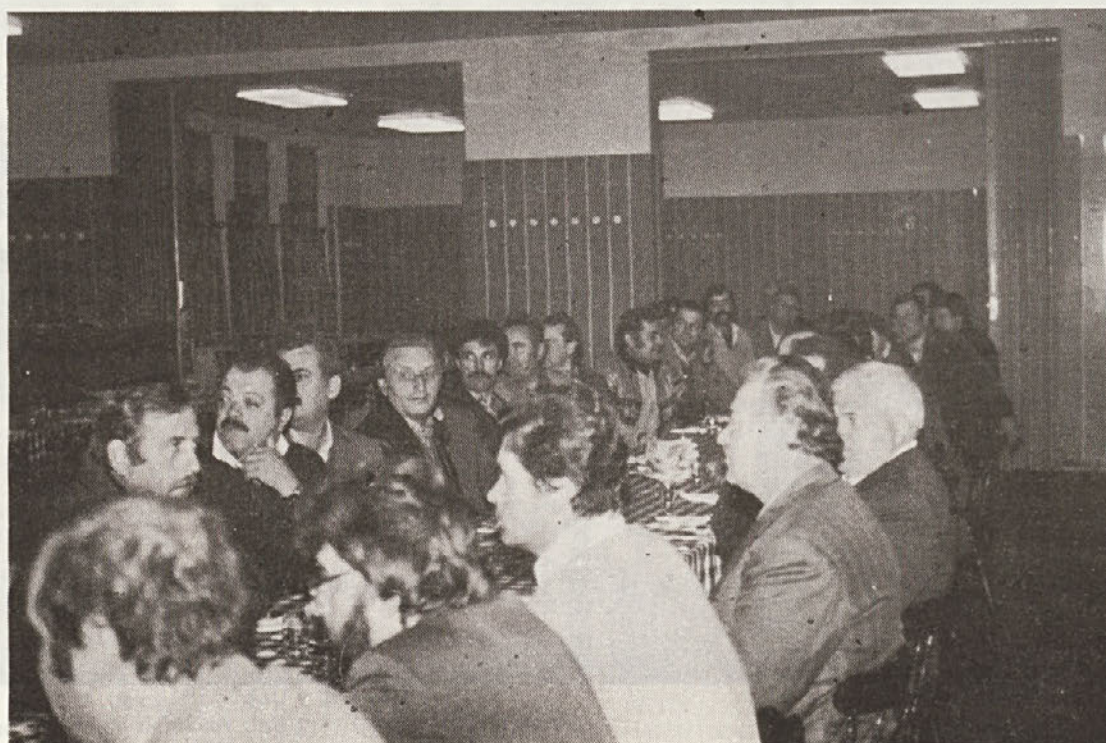
S srečanja krvodajalcev.

pričakujemo novice in prispevke tudi iz vaše temeljne organizacije!