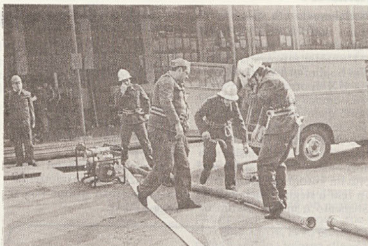
Gasilska desetina v priprava na napad.

Radijacijska je dekontaminacija odstranjivanje radioaktivnih tvari sa zatrovanih