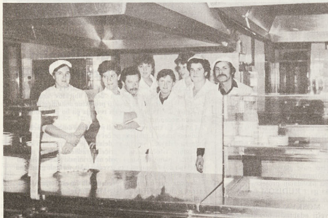
Delovna ekipa v naši restavraciji.