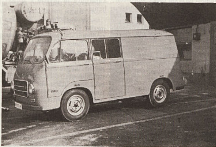
Nova pridobitev gasilskega društva Pionir — nov kombi.

posvetiti prašku, da nam ne pride v oči, zato ga uporabljamo in nanašamo na zastupljena mesta na obrazu z vato, pri dekontaminaciji oči, sluznice, prebavnih organov in nosu uporabljamo dvodostotno vodno raztopino sode bikarbone, s katero nevtraliziramo in mehanično izpiramo hlape bojnih strupov. Če dekontaminiramo prebavne