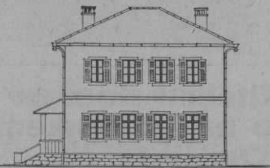
Тип школске зграде са 1 одјелјенијем.

Служећи одушевљено народним идеалима, а радећи под тешким условима но сви остали државни службеници, учитељи не желе само признања, већ траже стварне потпоре од свих фантора, како би се све горе указане незгоде, с њиховога тежобнега и мисионерскога пута уклониле.