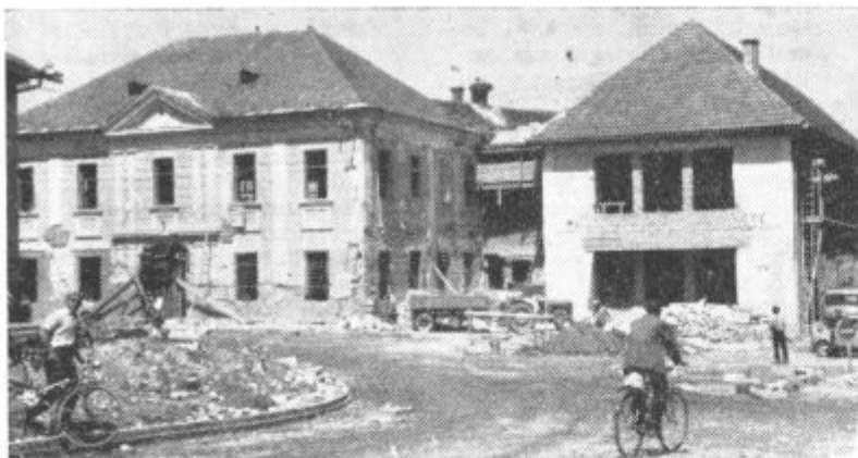
Središče Lenarta je te dni razkopano kot le kaj. Preurejajo gostilno »Grozd«, na sliki levo in kulturni dom, slika desno. Pospešeno se ureja tudi cesta v središču trga. Kakor vidite so robniki že postavljeni.