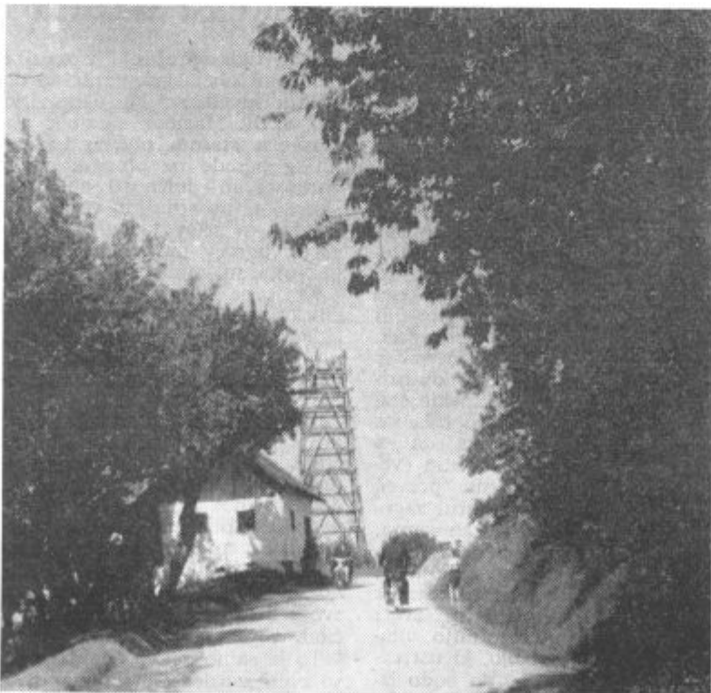
Razgledni stolp v Zavrhu — Prizadevni Završčani so že postavili razgledni stolp. S 24 metrov visokega stolpa je lep razgled po Slovenskih goricah

Podrobno bomo še poročali. V Zavrhu smo tudi izvedeli, da bo v prihodnje ob sobotah in nedeljah odprt bife v organizaciji Gostinskega podjetja Lenart, zasebniki pa so prijavi tudi 12 ležišč za turiste, ki se bodo zadrževali v tem prelepem kraju.