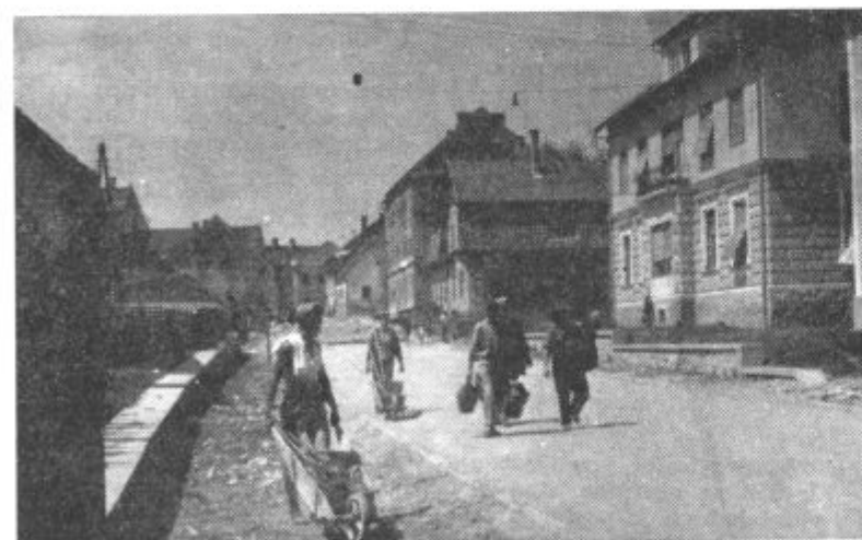
Plakovanje radgonske ceste v Lenartu hitro napreduje. Delavci so položili kocke že do središča trga. Na sliki: Del tlakovane ceste in delavci, ki se po končanem delu vračajo domov.