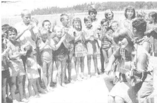
Veselo razpoloženje otrok na letovanju v Fažani

Zvečer smo odšli v Tivoli, največje in najlepše zabavišče v Evropi. Pravijo, da so ta park urejali nekaj stoletij, kar je zelo verjetno, saj je v kratkem času nemogoče ustvariti toliko različnih stilov in oblik. Po pravljicnem jezeru, prekritem z lokvanji, se vozijo obiskovalci v številnih čolnih in z vesli kodrajo gladko površino. Čudoviti vodometi, koncertne in plesne dvorane, igralnice in restavracije so za nas nekaj nenavadnega. Največja